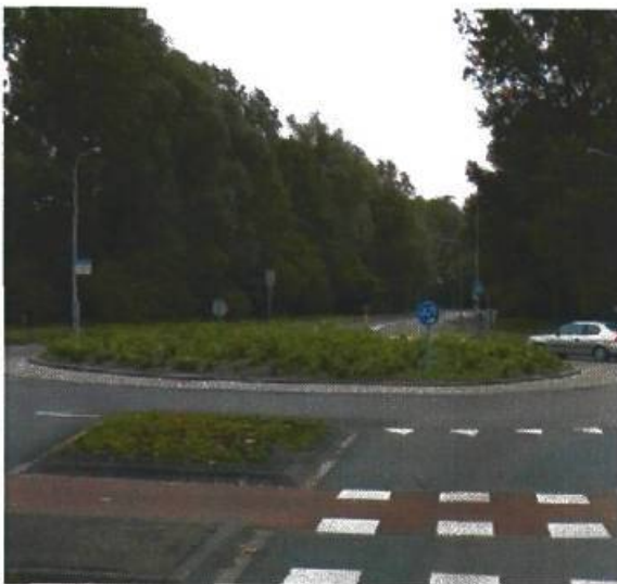
15. Bakboordswal / Lichtboei