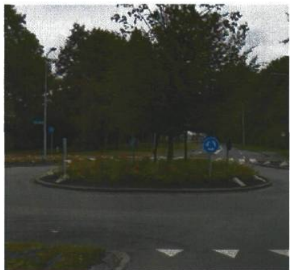
16. Bakboordswal / Meerpaal