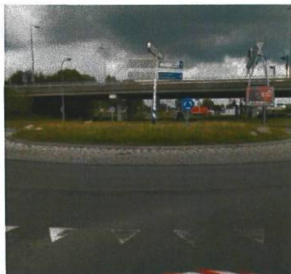
23. Bornholmstaat / Bergenweg