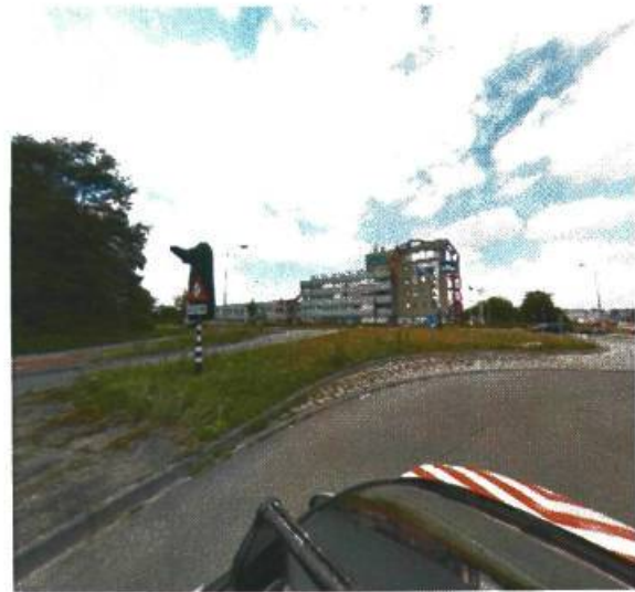
22. Osloweg / Gotenburgweg