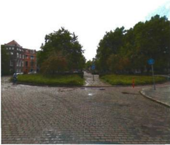
31. H.W. Mesdagplein