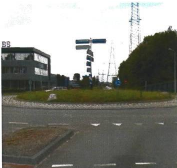
21. Gotenburgweg / Kielerbocht