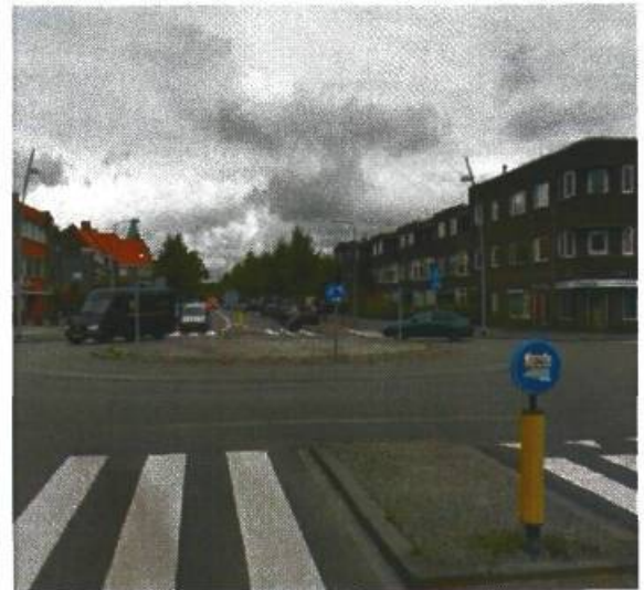
10. Korreweg / Sumatralaan