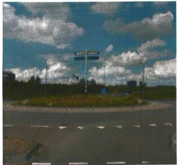
20. Kielerbocht / Skagerrak