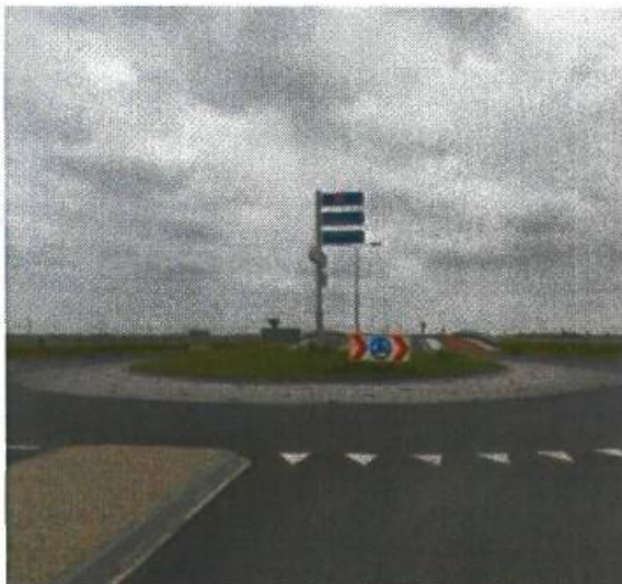
3. Westpoortboulevard / A7