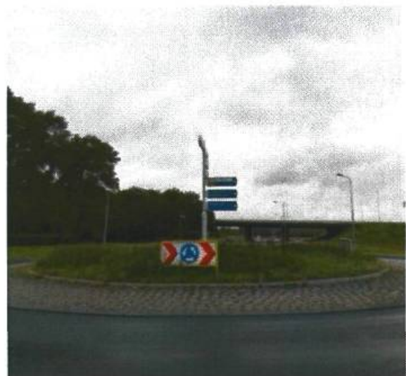
18. Driebondsweg / oprit ringweg