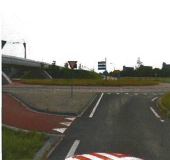
9. Friesestraatweg / Prof. Uilkensweg