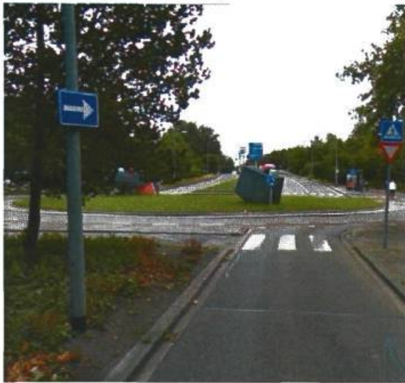
7. Siersteenlaan / Goudlaan