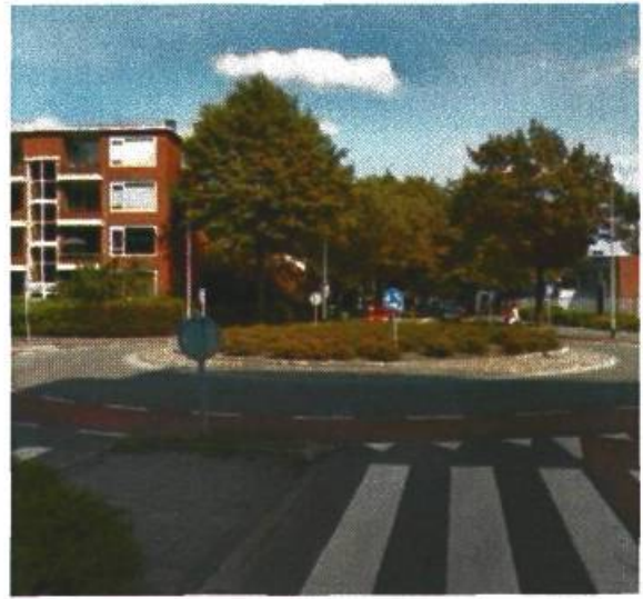
38. Vondellaan / van Iddekingeweg