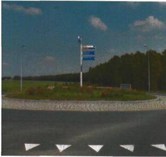
25. Afrit A7 / Europaweg