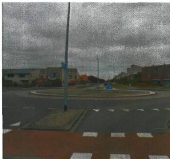
5. Johan van Zwedenlaan / Siersteenlaan