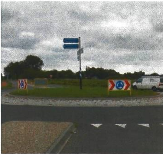
1. Westpoortboulevard / Hoendiep