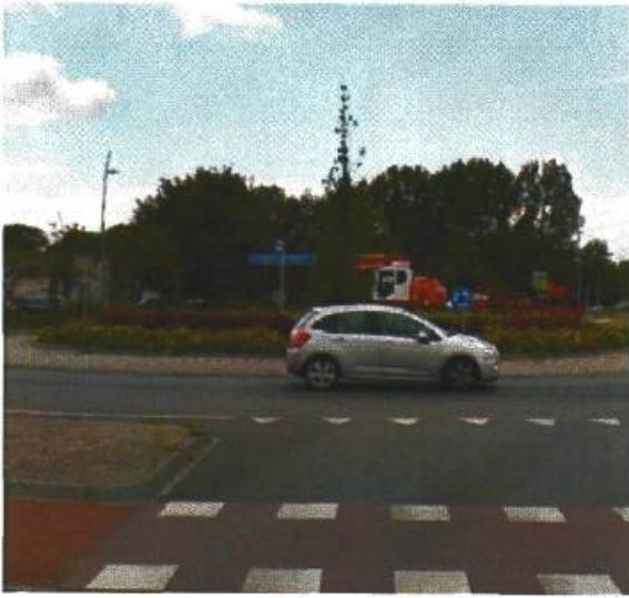
37. Laan Corpus de Hoorn / Boerhavelaan