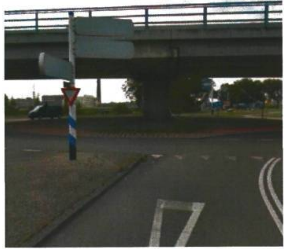
32. Hoendiep / Laan 1940-1945