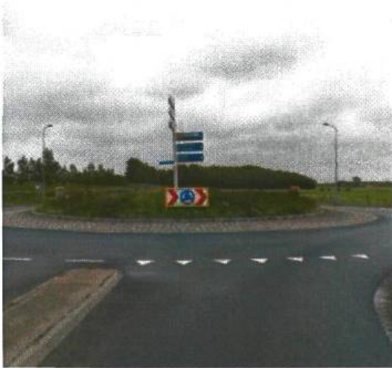
19. Driebondsweg / afrit ringweg