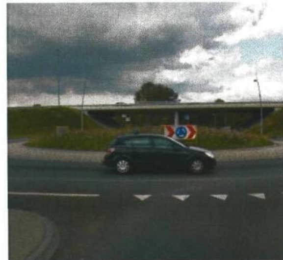
36. Laan Corpus de Hoorn / Afrit A7