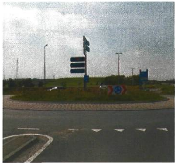
26. Europaweg / oprit A7