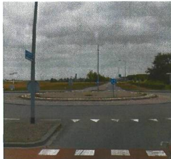
4. Hoendiep / Johan van Zwedenlaan