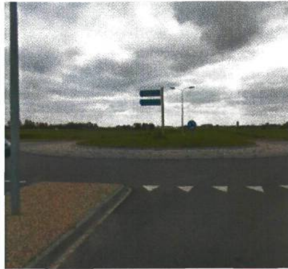
2. Westpoortboulevard / Londenweg