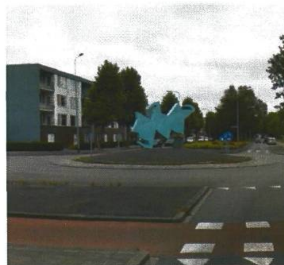
6. Siersteenlaan / Diamantlaan