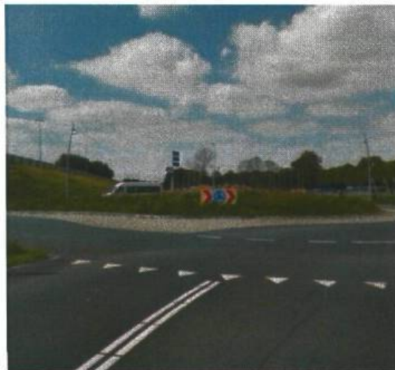
35. Laan Corpus de Hoorn / Stadspark