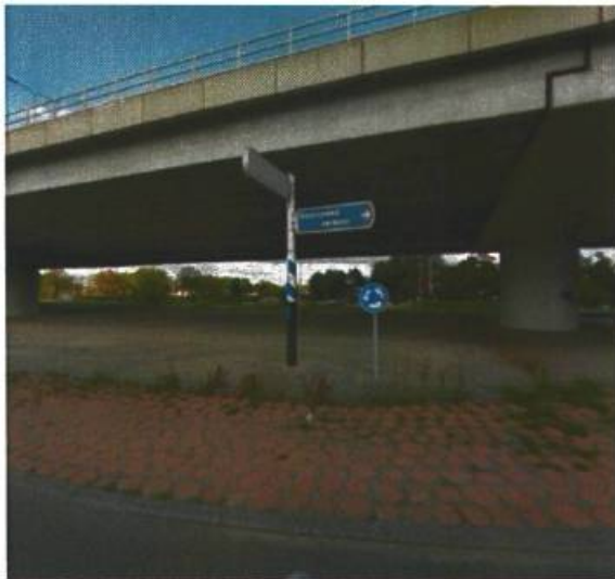
33. Laan 1940-1945 / afslag Suikerunie