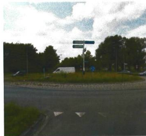
24. Bornholmstraat / Lubeckweg