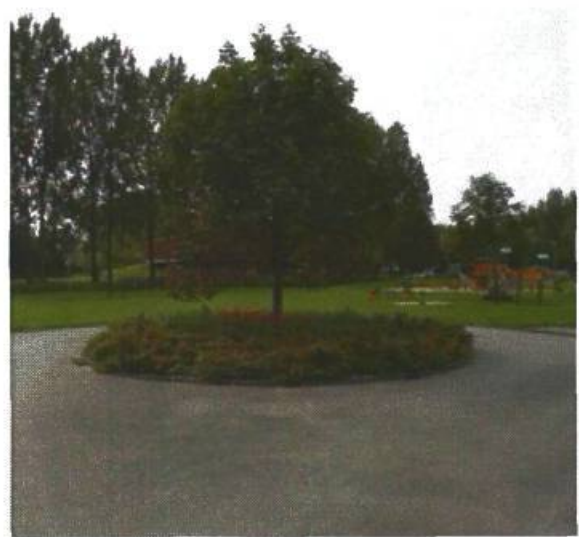
40. De Bazelstraat