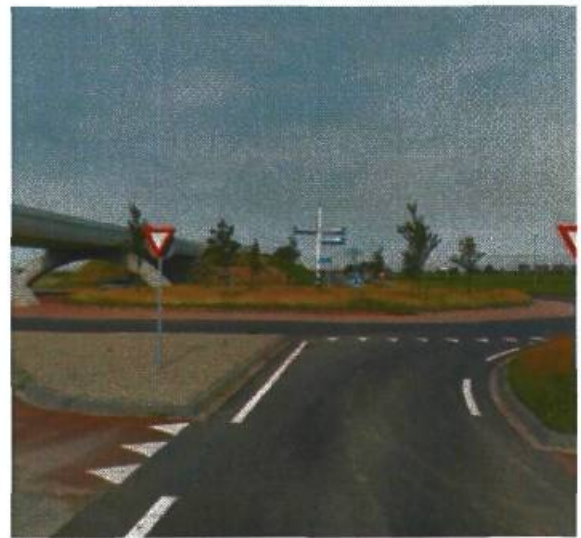
8. Friesestraatweg / Prof. Uilkensweg