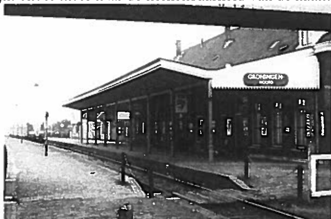
Figuur 1 Foto station Groningen Noord in 1966

Als de commissie het verzoek goedkeurt én de indiener/aanvrager garant staat voor de kosten, kan worden overgegaan tot de feitelijke naamsverandering.