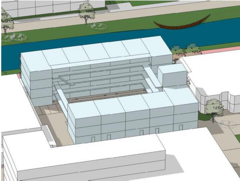
Impressie noordzijde.