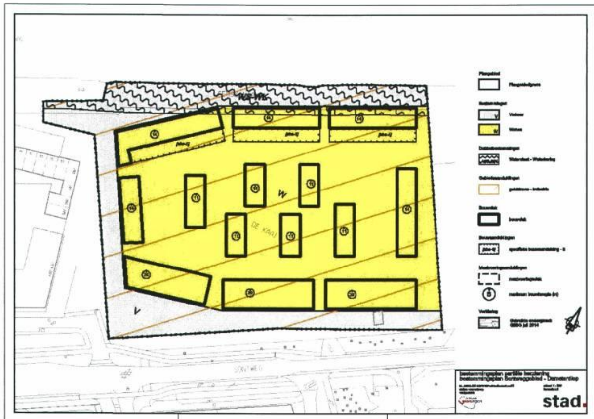
Verbeelding voorliggend plangebied met nieuwe regeling