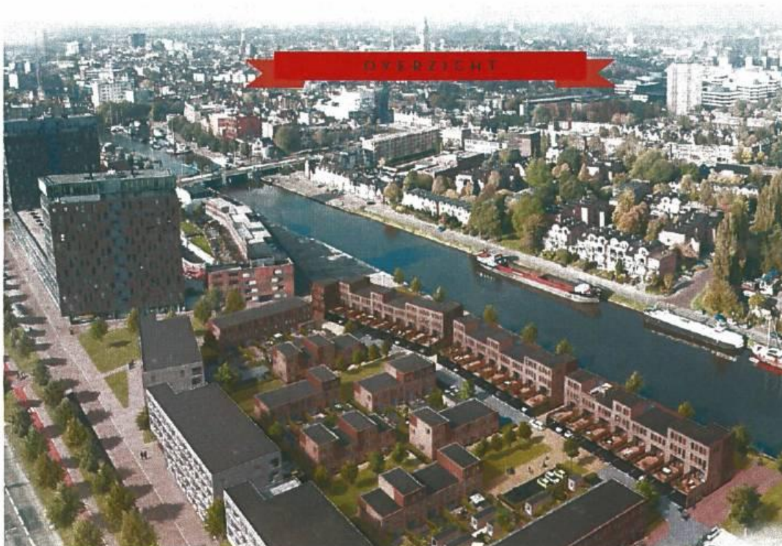
Indicatieve opzet van het project

Recentelijk is de gewenste invulling voor het Eemskwartier uitgekristalliseerd. Het afgelopen jaar is de eerste bouwaanvraag voor invulling van het gebied ingediend. Voorts loopt momenteel de verkoop van kavels erg goed, reden waarom binnenkort met voortvarendheid omgevingsvergunningen zullen worden ingediend. Echter, door een kleine bijzonderheid in de voorgenomen woonbebouwing is op enkele plaatsen - met name bij de kadewoningen - een bebouwingspercentage van 100% noodzakelijk. Het bestemmingsplan Sontweggebied-Damsterdiep voorziet echter voor het gehele terrein in een maximaal bebouwingspercentage van 75%, na toepassing van de afwijkingsbevoegdheid 85%. Vooralsnog is dit geen probleem, omdat het gehele terrein voor de berekening als uitgangspunt kan worden genomen nu het terrein nog niet onderverdeeld is in kadastrale kavels. Maar bij een verdere ontwikkeling van het terrein, en zeker na de eigendomsopdeling van het gebied, is wijziging van de regeling van het bebouwingspercentage (voornamelijk de verbeelding) gewenst. Het voorliggend bestemmingsplan voorziet hierin. Het gaat om een beperkte wijziging; de totale bebouwingsdichtheid van het terrein neemt niet toe, doordat de verbeelding is voorzien van bouwvlakken.