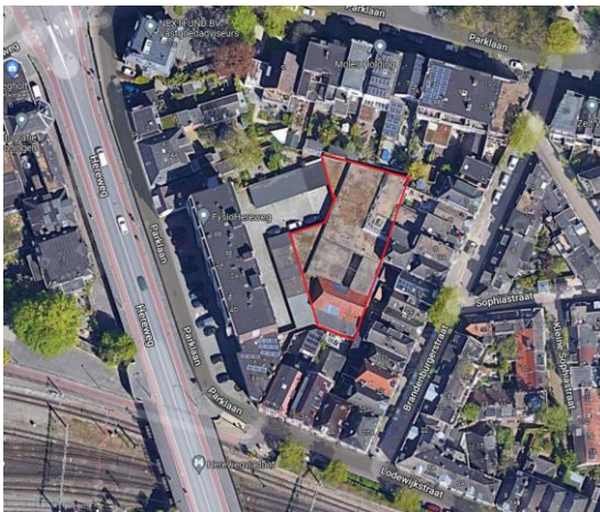
Figuur 1: ligging plangebied (rood omlijnd)

Het ontwerpbestemmingsplan 'Brandenburgerstraat 7-11' leggen wij gedurende 6 weken ter inzage in het kader van de zienswijzenprocedure (art. 3.8 Wet ruimtelijke ordening). Het plangebied betreft een volledig bebouwd binnenterrein, gelegen achter Brandenburgerstraat 7-11.