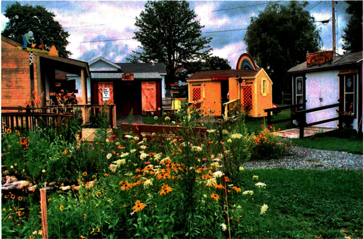
Een initiatiefvoorstel van GroenLinks & Partij voor de Dieren September, 2016