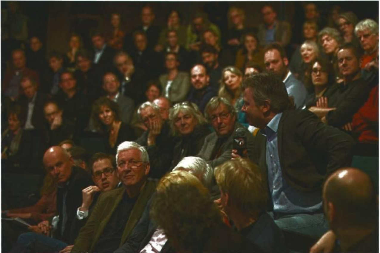
De zaal discussieert mee