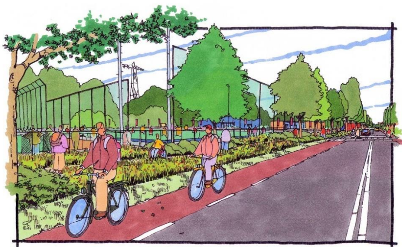
Impressie I voetpad Blauwborgje