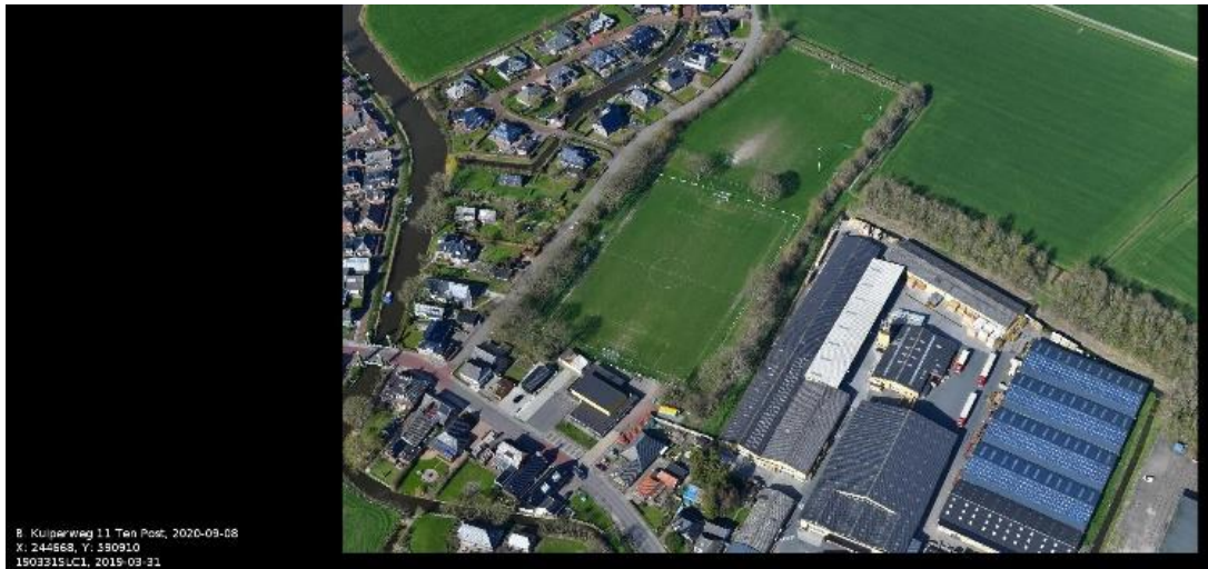
Locatie dorpshuis/gymzaal en sportvelden B. Kuiperweg Ten Post

In het begin van 2018 is in Ten Post begonnen aan een inventarisatie van behoeften en kansen om in de komende jaren tot verbetering en versterking van het dorp te komen. Dit in lijn met de uitspraak van het college van Ten Boer: "De dorpen moeten sterker uit de versterking komen". Deze ambitie is enthousiast aangepakt met een breed expertteam (met o.a. Laos landschapsarchitecten en bureau Specht). De uitkomsten zijn verwoord in een tussen-visie document. Hiervoor is een uitgebreide ruimtelijke verkenning uitgevoerd. In samenspraak met alle partijen is besloten dat de locatie "dorpshuis/gymzaal en sportvelden" de beste optie is.