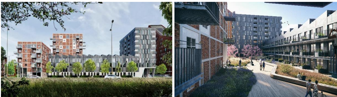
Voorzijde Friesestraatweg 175 en binnentuin met openbaar toegankelijk pad

In de Reitdiepzone vindt al decennia lang een transformatie plaats. In de “Next City” is de Reitdiepzone aangewezen als ontwikkelzone. We kiezen er bewust voor om in stedelijk gebied te bouwen, waardoor er geen beslag wordt gelegd op de groene randen van de stad en wel een positieve bijdrage wordt geleverd aan het woningtekort. De oorspronkelijke functie voor de zone – handel en industrie – is grotendeels verleden tijd. Vanwege de ligging – dicht bij het centrum en bij het ommeland – is deze zone ook zeer geschikt voor woningbouw. Het deelproject Friesestraatweg 175 maakt onderdeel uit van de Reitdiepzone. Hier worden 156 vrije sector huurwoningen gerealiseerd.