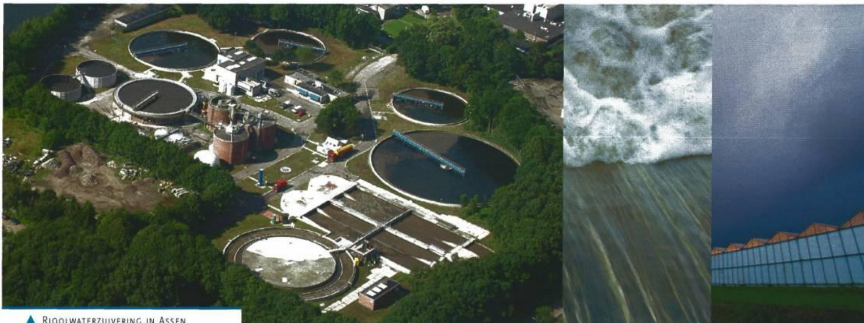
▲ RIJOLWATERZUIVERING IN ASSEN