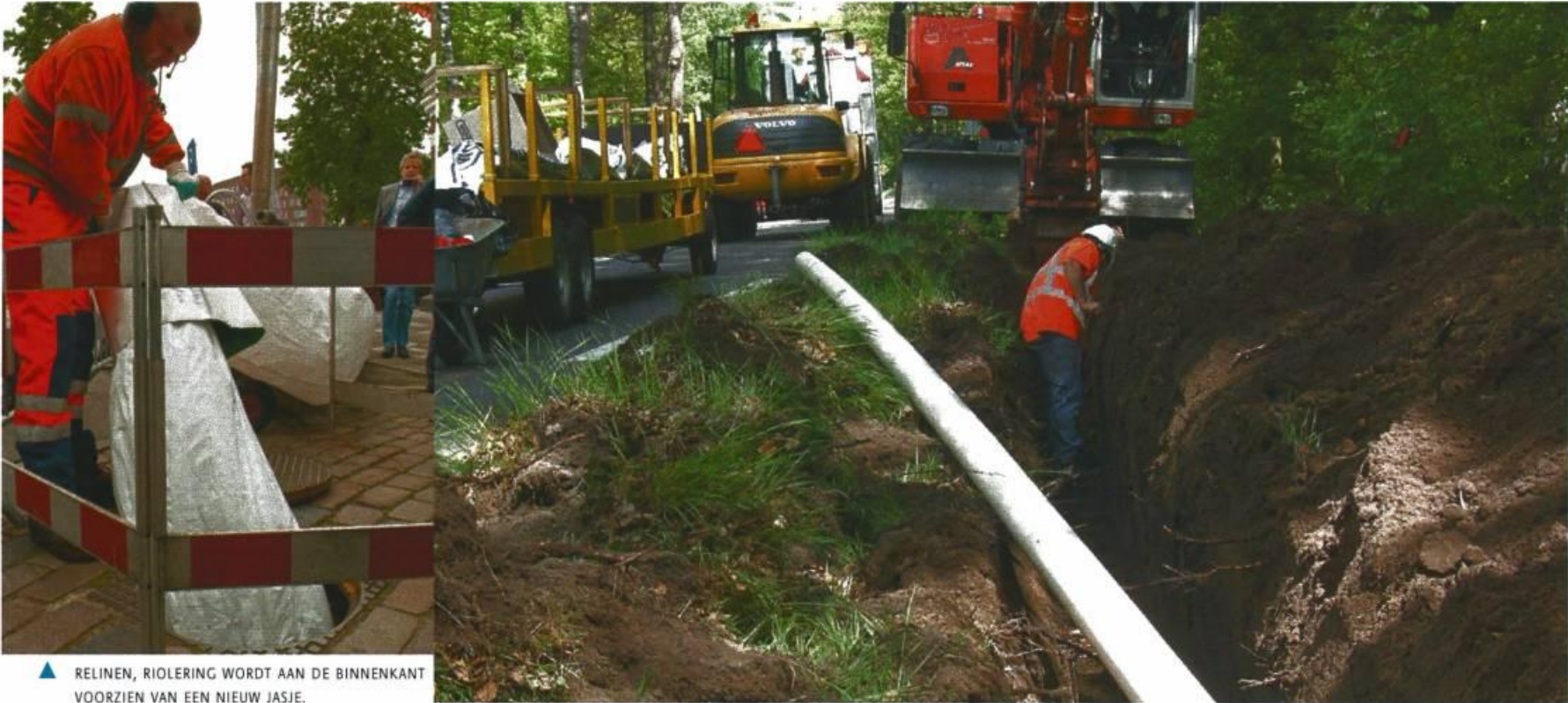
▲ RELINEN, RIOLERING WORDT AAN DE BINNENKANT VOORZIEN VAN EEN NIEUW JASJE.

..... Samenwerken betekent altijd dat je moet inleveren op eigen gewoontes. Dat is niet altijd eenvoudig. Toch lijkt het op een aantal vlakken goed te lukken.