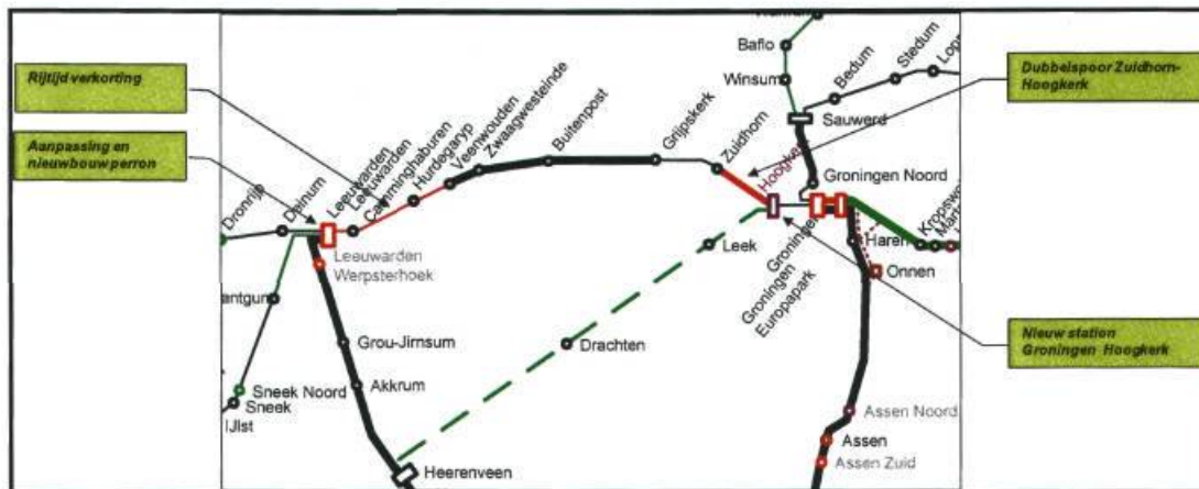
Figuur 1: Benodigde infrastructurele maatregelen op kaart.

Ook station Hoogkerk valt inhoudelijk binnen de scope van het project en wordt vanuit dit project aangelegd als het projectbudget dit toelaat. Als gevolg van de frequentieverhoging wordt verder ook gekeken naar de overwegveiligheid en eventueel benodigde geluidswerende maatregelen.