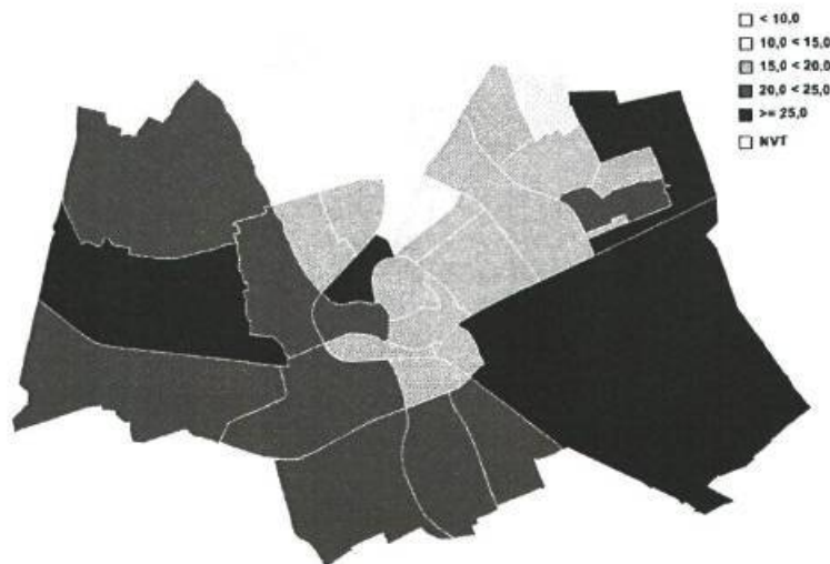
Figuur 4.1 Percentage kinderen van 5 tot en met 17 jaar dat op een stad-Groninger voetbalvereniging zit, buurten, 2010

Figuur 4.1 geeft per buurt in Groningen het percentage van 5 tot en met 17 jarigen weer dat lid is van een voetbalvereniging. Uit de figuur blijkt dat het percentage jeugdleden per buurt sterk verschilt, 8 procent in de Hoogte tot 30 procent in de Oranjebuurt. Als we bij deze indicator een koppeling maken met het gemiddelde inkomen in de verschillende buurten, dan blijkt dat in buurten met een lager gemiddeld inkomen het percentage dat lid is van een voetbalvereniging lager ligt dan gemiddeld.