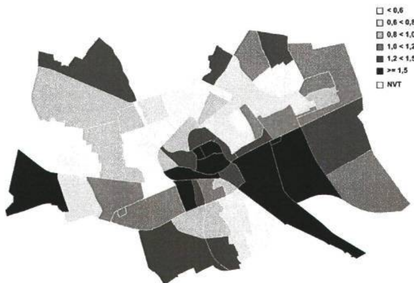
Figuur 3.1 Gemiddelde afstand in kilometers tot een sportterrein, buurten, 2006

De gemiddelde afstand van alle inwoners tot het dichtstbijzijnde dagrecreatief terrein (dit zijn in Groningen de gratis toegankelijke zwemplassen met bijbehorende voorzieningen) is berekend over de weg in kilometers. Voor Nederland is dit gemiddeld 3,5 kilometer en in Groningen 2,6 kilometer.