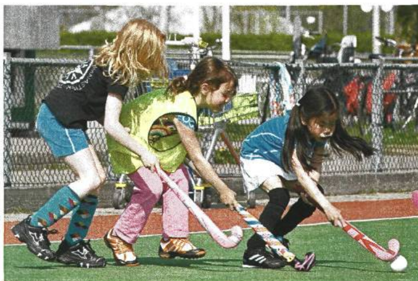
Tabel 4.7 Lidmaatschap van een sportvereniging naar leeftijdsgroep