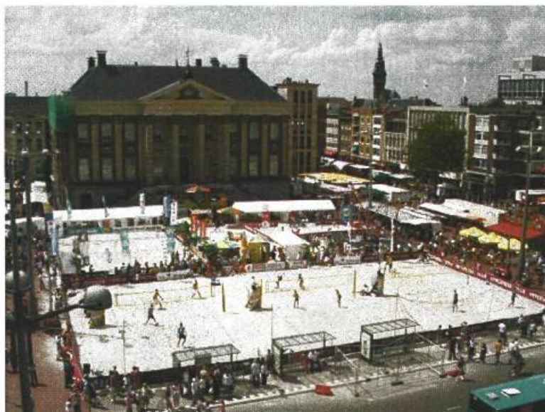
Beachvolleybaltoernooi georganiseerd op de Grote Markt.