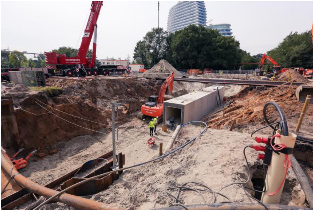
Afbeelding: aanleg kabelkanaal (augustus 2017)

Hoewel het een innovatieve oplossing lijkt, zijn er redenen waarom het tijdelijk gebruik van het kabelkanaal voor voetgangers (en verkeersdeelnemers in een rolstoel of scootmobiel) niet mogelijk of wenselijk is: