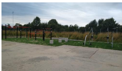
Nieuwe beweegplek Ten Boer