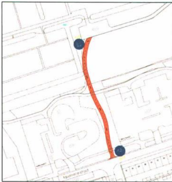
Afbeelding 6: fietspad Aquamarijnstraat-Friesestraatweg

Het voetpad ten noorden van de flats aan de Aquamarijnstraat wordt al geruime tijd gebruikt door fietsers. Dit leidt regelmatig tot incidenten tussen fietsers en voetgangers. Om tegemoet te komen aan de wens van de bewoners, willen we het bestaande zandpad bij het Volkstuinencomplex Vinkhuizen verhard en doortrekken over het aanwezige grasveld tot aan de Aquamarijnstraat (zie afbeelding 6). Om te voorkomen dat fietsers ook in de toekomst gebruik blijven maken van het voetpad, plaatsen we aan de westzijde van het voetpad een voetgangershek. De aanleg van dit fietspad vindt na de bouwvakvakantie plaats.