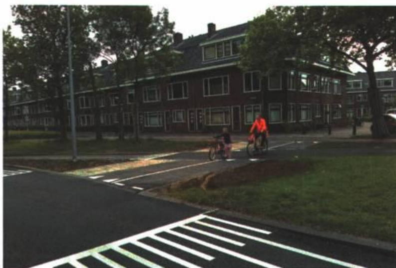
Afbeelding 4: fietsoversteek Prinsesseweg

Onder meer op verzoek van de Nassauschool hebben we gelijktijdig met groot onderhoud aan de Prinsesseweg een fietsoversteek aangelegd ter hoogte van de Stadhouderslaan en het Albertine Agnesplein (zie afbeelding 4). In verband met de verkeersveiligheid van de fietsoversteek is een verkeersplateau aangelegd die de snelheid van het autoverkeer remt. Inmiddels constateren we dat de fietsoversteek goed gebruikt wordt door zowel bewoners uit de Oranjebuurt als ouders met kinderen van de Nassauschool. Binnenkort wordt de fietsoversteek nog voorzien van een rode slijtlaag; bovendien wordt aan de noordzijde een voetgangersoversteekplaats aangelegd.