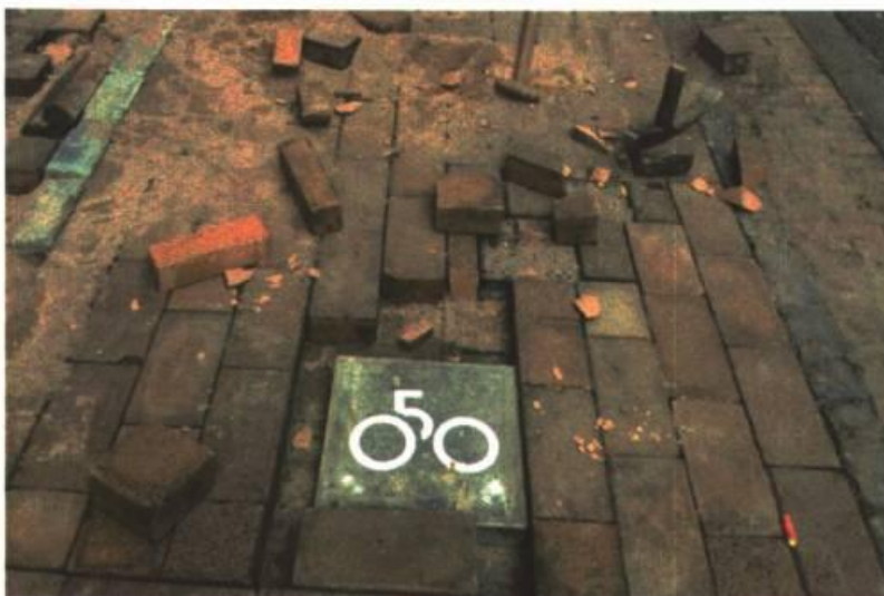
Afbeelding 3: fietsvakken Oosterstraat

Samen met de ondernemers hebben we een plan gemaakt voor de aanleg van fietsvakken in de Oosterstraat (zie afbeelding 3). Deze vakken, die vooral bedoeld zijn voor kortstallers en om die reden worden aangelegd in het kernwinkelgebied, zijn onlangs gerealiseerd. Bij de herinrichting van de straat hebben de ondernemers tevens nieuwe zitbankjes en informatieborden laten plaatsen. Ter promotie van de fietsvakken hebben we tijdens de officiële ingebruikname gratis fietsenstanders uitgedeeld.