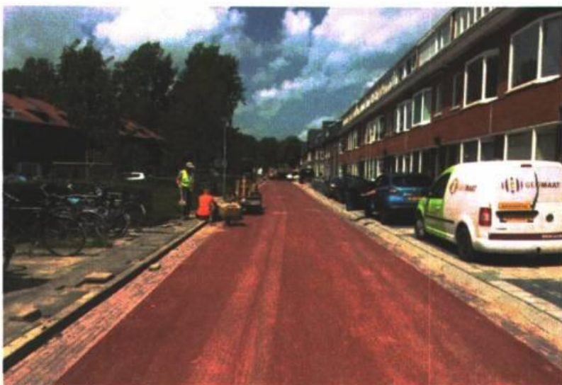
Afbeelding 2: fietsstraat Bessemoerstraat

De Bessemoerstraat is inmiddels heringericht als fietsstraat (zie afbeelding 2), de eerste échte fietsstraat van Groningen! Kenmerkend voor een fietsstraat is dat de fietser centraal wordt gesteld en dat de automobilist te gast is. De inrichting van de straat, met een rode rijloper van 4 meter en uitwijkstroken van 0,5 meter aan weerszijden, straalt dit principe ook uit. Het parkeren is op trottoirniveau gebracht, zodat de rijbaan vrij blijft van geparkeerde voertuigen. In overleg met de scholen is de problematiek rond de schoolomgeving aangepast.