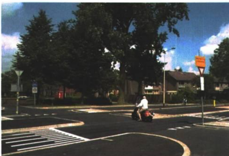
Afbeelding 1: fietsoversteek Pleiadenlaan

In juni hebben we de fietsoversteek Pleiadenlaan als onderdeel van de Slimme Route via het Jaagpad aangepast (zie afbeelding 1). Door het opheffen van de busstrook hoeft de fietser in de nieuwe situatie nog maar één rijstrook per keer over te steken. Tevens hebben we de middenberm kunnen verbreden waardoor de opstelcapaciteit hier vergroot is. Bovendien hebben we de opstelcapaciteit aan weerszijden van de Pleiadenlaan zelf vergroot door de fietspaden parallel aan de Pleiadenlaan iets uit te buigen. De toevoeging van een verkeersplateau remt de snelheid van het autoverkeer en zorgt er daarmee voor dat de oversteek verkeersveiliger en comfortabeler voor de fietser is geworden.