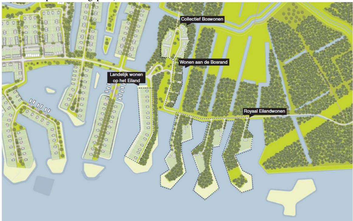
Stedenbouwkundig concept ontwerp Harksteder Broeklanden woongebied (indicatieve verkaveling)

Deze uitgangspunten hebben geleid tot onderstaand concept stedenbouwkundig plan. De uitwerking van dit plan (Meerstad-Harksteder Broeklanden) en het daarbij behorende beeldkwaliteitsplan vindt u in de bijlage van deze brief (het beeldkwaliteitsplan als bijlage 1 in de bijlagen bij de toelichting van het voorontwerpuitwerkingsplan).