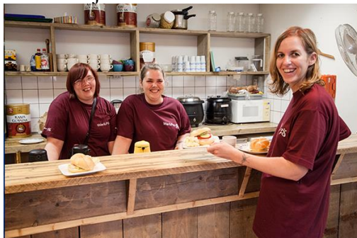
Impressie van algemene voorziening van GON-aanbieder Ben in de Buurt