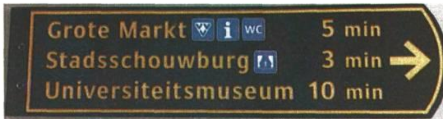
Figuur 1 Voorbeeld van definitief ontwerp

De bestemmingen op de nieuwe borden wijken niet af van de huidige bewegwijzering. Wel vindt er een aanvulling plaats: podia, parkeergarages, de synagoge, een aantal openbare toiletten, het UMCG en het Sontplein. Bestemmingen die niet op de borden staan, worden wel genoemd op de binnenstadsplattegrond, zie figuur 2.