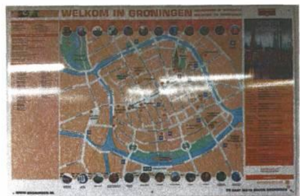
Figuur 3 Plattegrond parkeergarage