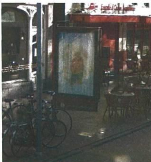
Figuur 2 Binnenstadsplattegrond

Ook de plattegrond in parkeergarages wordt geactualiseerd in overleg met Marketing Groningen, zie figuur 3.