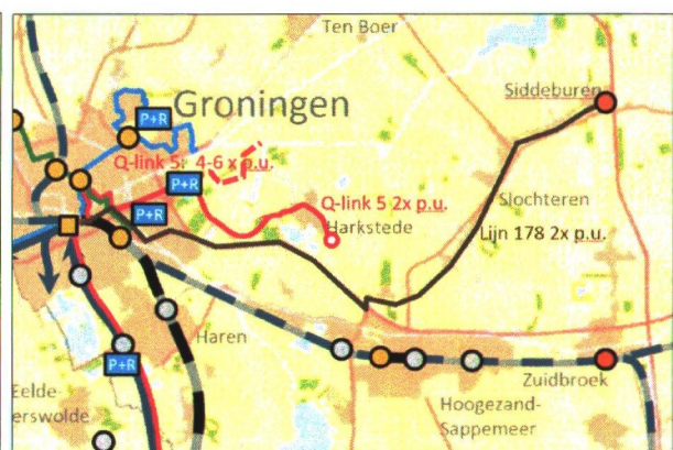
Figuur 2: voorgestelde OV-ontsluiting (gestippeld mogelijk toekomstige route via Meerstad)