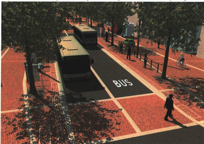
Nieuwe centrumhalte Westerhaven

Het voorstel is om op lijn 8 na de bovenstaande lijnen via het Gedempte Zuiderdiep te laten rijden. Specifiek met betrekking tot de routevoering van lijn 8 geldt dat onder regie van de gemeente Groningen nog een enquête plaatsvindt onder in ieder geval huidige gebruikers van lijn 8 om de noodzaak van de routevoering over het Gedempte Zuiderdiep te onderzoeken of dat een route vanaf de Eeldersingel rechtstreeks door naar het Hoofdstation te prefereren is. De uitkomsten van dit onderzoek zullen mede bepalen of het voor lijn 8 wenselijk is een 'lusje' via het Zuiderdiep te rijden.