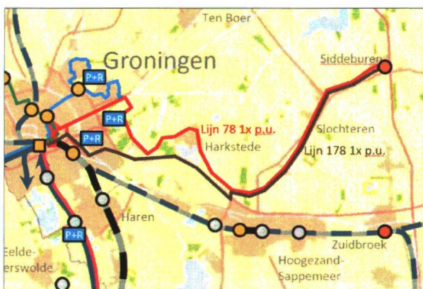
Figuur 1: huidige OV-ontsluiting

Een deel van de ritten vanaf P+R Meerstad verlengen naar Ter Sluis is ook onderdeel van deze gedachte. Dit nieuwe gedeelte van Meerstad zal de komende jaren ontwikkeld worden. Door hier vanaf het begin een busverbinding te bieden zorgen we ervoor dat het openbaar vervoer vanaf het moment dat de eerste bewoners zich vestigen een vanzelfsprekendheid is in deze wijk.