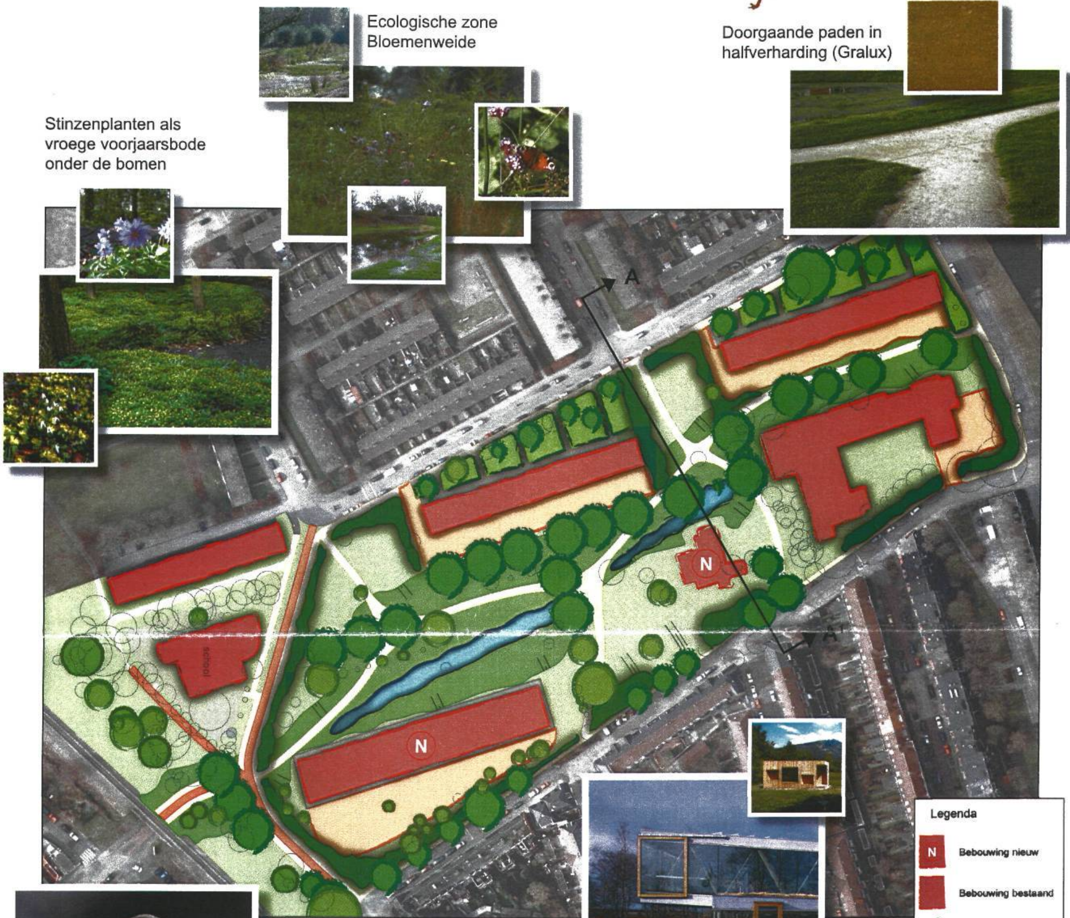
Ecologische zone Bloemenweide