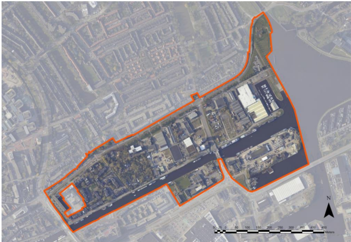
Begrenzing plangebied omgevingsplan