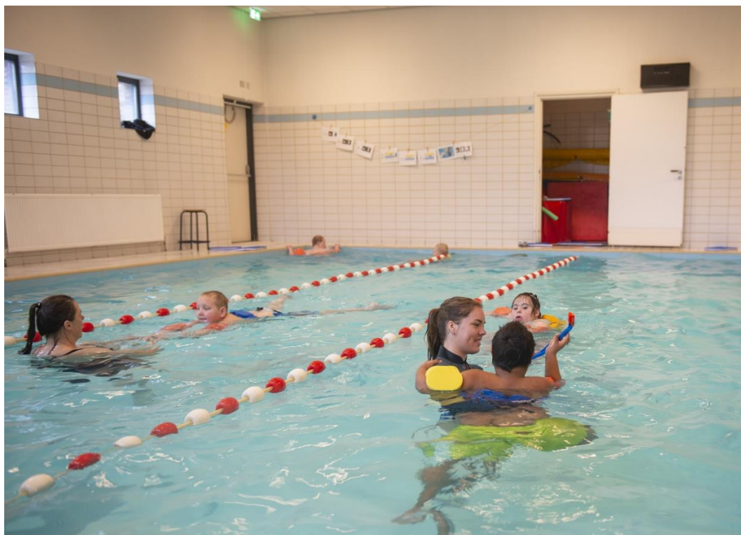
Afbeelding 1: Zwempilot op de W.A. van Lieflandschool

organiseren van activiteiten aanbod is er aandacht geweest voor zichtbaarheid door verspreiding van flyers in samenwerking met Welzorg en door aanpassingen op de website van Sport050. Ook zijn er verschillende loketaanvragen voor bijvoorbeeld inwoners die geschikte sporten zochten, in acties omgezet.