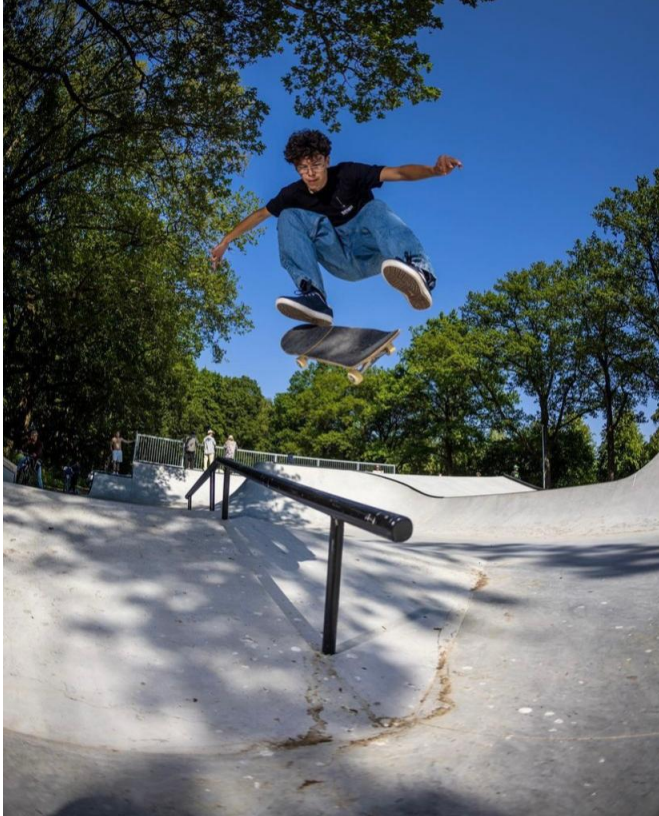
Afbeelding 3: Skatepark Stadspark

Daarnaast wordt in juni het indoor skatepark het Colosseum afgebouwd. Begin 2022 is het skatepark Colosseum verhuisd van de Travertijnstraat naar de Koningsweg. Het Colosseum is al bijna een jaar bezig om het nieuwe skatepark op te bouwen, maar dit blijkt een grote opgave. Daarom is vanuit de Bewegende Stad een financiële bijdrage beschikbaar gesteld. Met de realisatie van het outdoor skatepark Stadspark en indoor skatepark Colosseum zorgen we ervoor dat een grote groep skaters, inliners, steppers en BMX-ers de komende jaren terecht kan op kwalitatief hoogwaardige locaties.