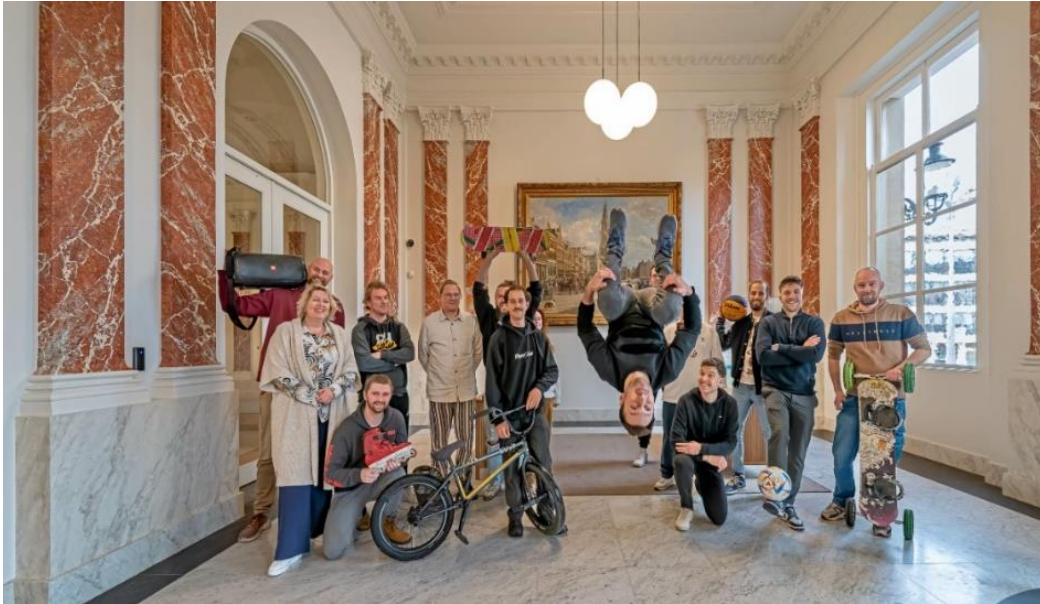
Afbeelding 4: Bekrchtiging Urban Sports Netwerk 31 maart 2023

Ambitie 4: “Onze ambitie is om onze wijken, buurten en dorpen zo in te richten dat iedere inwoner lage drempels ervaart om te sporten, spelen, bewegen en elkaar te ontmoeten in de openbare ruimte”