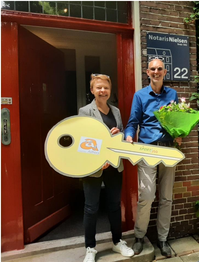
Afbeelding 2: Afronding gelijk Speelveld Astrea

Met de herindeling in 2019 was de opdracht om voor de nieuwe gemeente Groningen gelijke afspraken te maken, te beginnen met het project Gelijk Speelveld waarbij het juridisch eigendom van de club- en kleedgebouwen is vastgelegd en de vergoedingen voor kleedkamers toegepast worden. Door de jaren heen waren er verschillende afspraken gemaakt met sportclubs. We zijn blij te kunnen mededelen dat het project Gelijk Speelveld voor de gehele gemeente in de afrondende fase zit. Op de agenda van uw raad in juli 2023 zal het raadvoorstel ter afronding van dit project worden besproken.