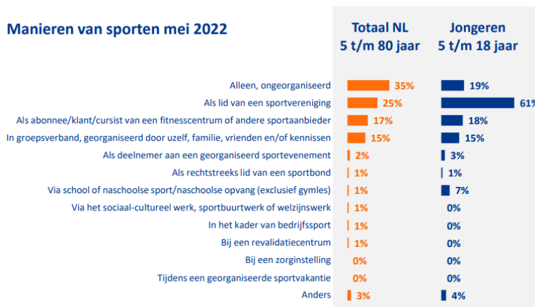
Manieren van sporten mei 2022

Er wordt in Groningen al geruime tijd stevig ingezet op sporten, bewegen, spelen en ontmoeten in de openbare ruimte. Tijdens de coronapandemie hebben we hier de vruchten van mogen plukken en hebben nog meer inwoners de waarde hiervan ervaren. Sport en bewegen in de openbare ruimte, zowel individueel als zelfgeorganiseerd samen, blijft ook na de coronapandemie onverminderd populair (zie tabel).