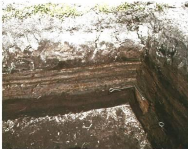
Profiel van een veenterp (opgraving in Drenthe, Eelderwolde)

De toegankelijkheid van het gebied was slecht, en de bewoning zal niet makkelijk zijn geweest; bevaarbare sloten bestonden niet, en wegen die rijdend verkeer konden dragen zijn ook niet aangetroffen. Het gebied heeft bovendien vrij vaak onder water gestaan. De bewoning in het gebied is dan ook van korte duur geweest, en gebonden aan een iets drogere periode tussen 1150 en 1250. De terpjes zijn waarschijnlijk niet langer dan een of twee decennia bewoond gebleven, en het is niet onwaarschijnlijk dat er alleen in de zomer gewoond werd. Na 1250 trad er een toenemende neerslag op, waardoor er een (of meerdere malen) inundatie optrad die de huizen verwoestte en bewoning verder onmogelijk maakte. De terpjes zijn de laatste restanten van het nu verdwenen veenlandschap, en zijn nog altijd onderwerp van studie. Vooral de vraag wat deze mensen in dit onherbergzame gebied deden spreekt nog altijd tot de verbeelding. Sommige onderzoekers menen dat hier alleen seizoensbewoning in de zomer mogelijk was, anderen dat het om normale boerenbedrijven ging, en weer anderen stellen (op basis van gevonden potvormen) dat op deze plekken hier sprake is geweest van proto-ambachtelijke bierbereiding.