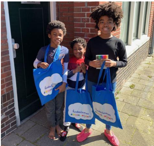
Kinderdromen in de Indische Buurt / de Hoogte

In Beijum willen we in 2020 starten met de uitvoering van de maatregelen uit het Actieplan Openbare Ruimte dat we vorig jaar samen met buurtbewoners hebben opgesteld. Door de coronamaatregelen zoeken we ook hier naar andere participatievormen om toch in gesprek te blijven met de bewoners. Gezamenlijk met scholen, ouders, WIJ Beijum en kinderopvangorganisatie is een plan opgesteld tbv het vergroten van het perspectief van jeugd in Beijum en extra aandacht voor kinderen van 0 tot 2 jaar. Dit plan is in uitvoering en voor de uitvoering hiervan is extra jeugdwerk ingezet en is een projectleider voor het project Kansrijke Start aangesteld. Tot slot gaan we door met de heerdenaanpak: op dit moment zijn de Galkemaheerd, Godekenheerd en Isebrandtsheerd in uitvoering.