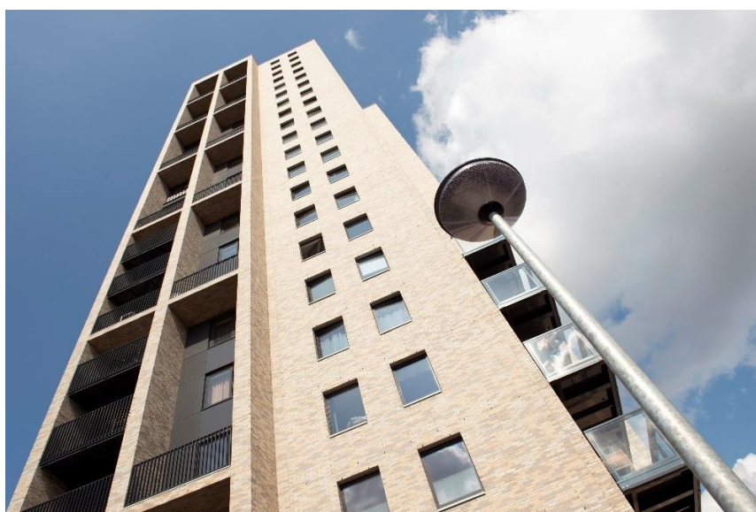
Jongerenhuisvesting Paddepoel: Polaris

In de koop zijn 89 woningen in het middensegment (vanaf € 185.000 tot € 285.000) gerealiseerd en 313 in het hoge segment (vanaf € 285.000,-)