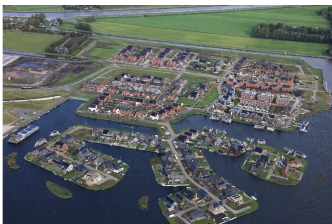
Meerstad – Tersluis

In de koop zijn 121 woningen in het middensegment (vanaf € 185.000 tot € 285.000) gerealiseerd en 356 in het hoge segment (duurder dan € 285.000,-). Er zijn dus veel woningen in de sociale en middenhuur categorie toegevoegd. Hiermee geven we invulling aan onze opgave om ook vooral betaalbaar aanbod toe te voegen. We streven ook naar meer betaalbare koopwoningen. Het is echter in de huidige woningmarkt niet realistisch om in deze prijscategorie de kwaliteit te realiseren die wij voor ogen hebben.