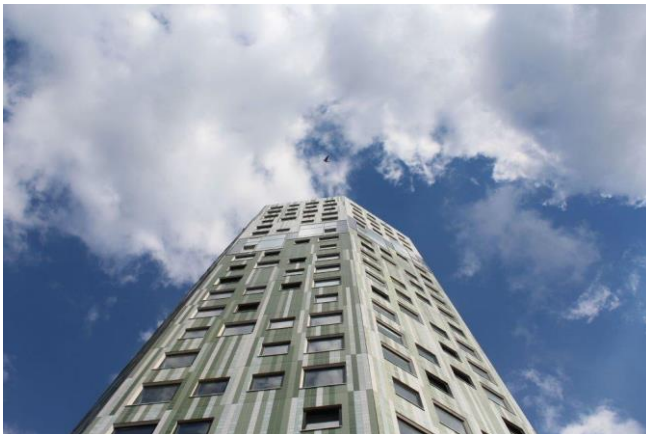
Helix in De Hoogte

In 2020 is er een aantal grote projecten opgeleverd. Onder andere de Zernike Tower in Reitdiep, 699 woningen. De Atlas in Paddepoel met 224 woningen en de Helix in De Hoogte, met 212 woningen. In totaal zijn 1.154 woningen specifiek gericht op jongeren. In Haren zijn in totaal 30 woningen gerealiseerd. Dit zijn voornamelijk vrije kavels en een aantal 2-onder-1-kap woningen in Haren-Noord. In Ten Boer zijn nog eens 45 woningen gerealiseerd en in Ten Post 30 aan de Huisburen.