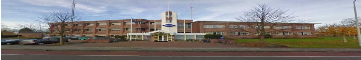
Gemeente Ten Boer