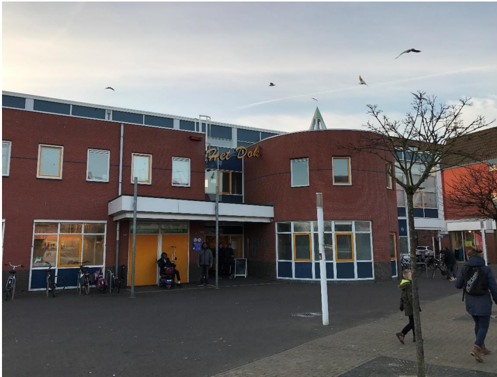
Wijkcentrum Het DOK Kajuit 4