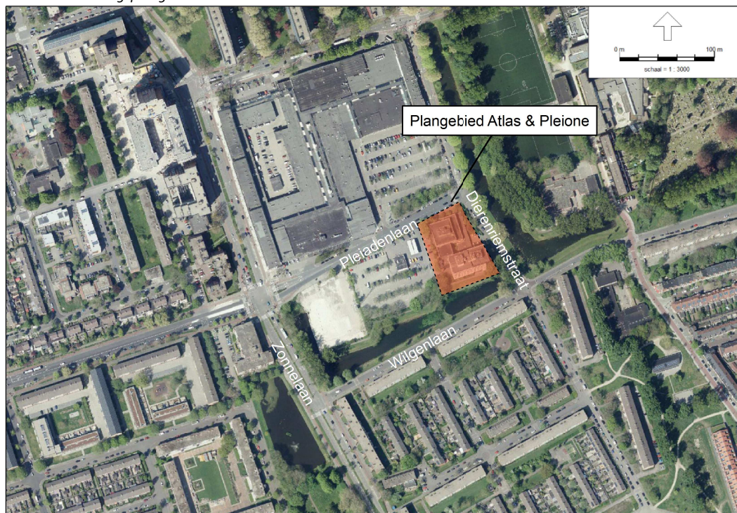
f2.1 Globale aanduiding plangebied

Het plangebied van Atlas en Pleione is gelegen in de wijk Paddepoel in de stad Groningen, aan de kruising van de Dierenriemstraat met de Pleiadenlaan (Dierenriemstraat 100). De situatie is weergegeven in het onderstaande figuur 2.1.