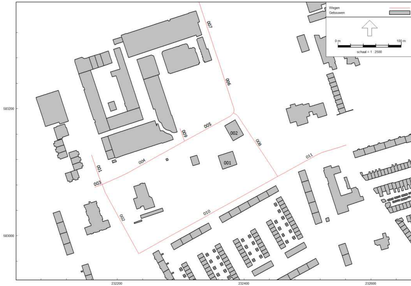
Figuur 1.1: invoerplot rekenmodel – gebouwen en wegen