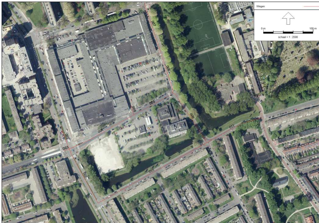
t4.2 Verkeersgegevens voor prognosejaar 2030