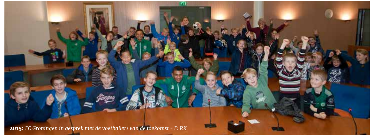
2015: FC Groningen in gesprek met de voetballers van de toekomst