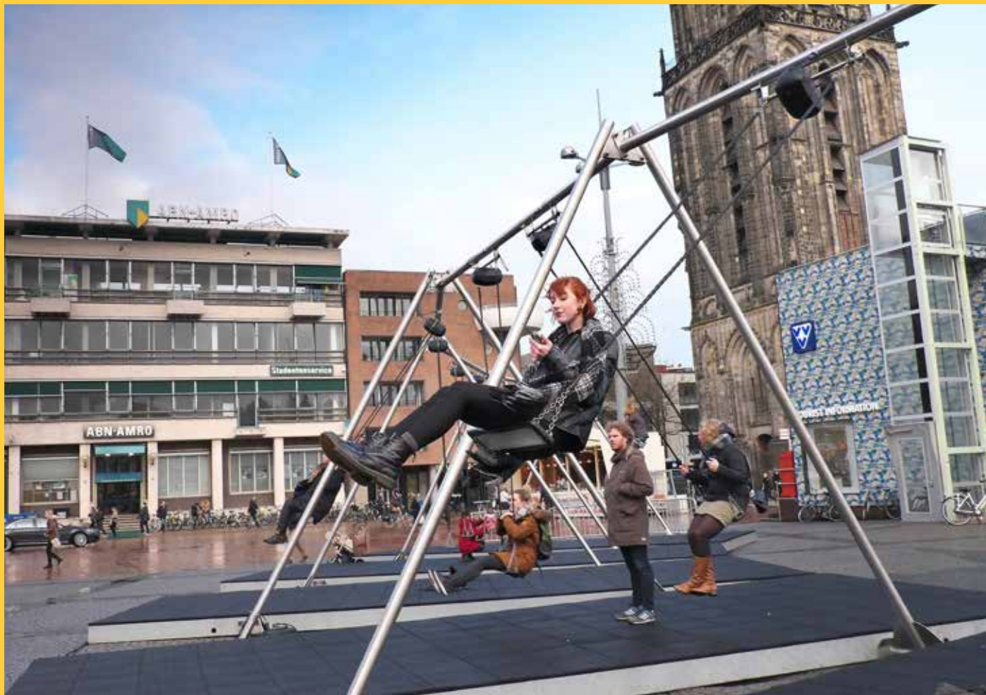
ONDER: 2015: WANNAPLAY