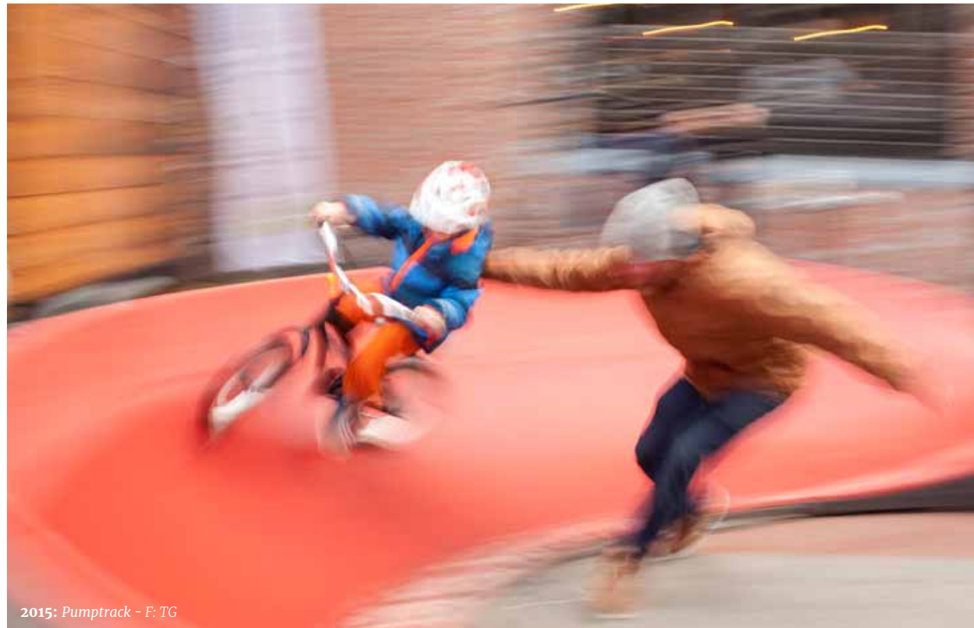
2015: Pumptrack