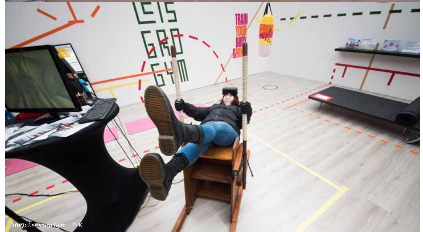
2017: Let's Gro Gym - F: K