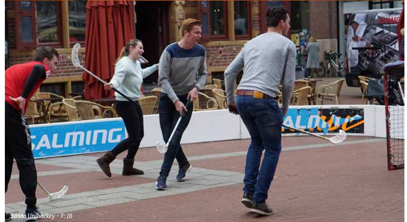
2016: Unihockey - F: JB