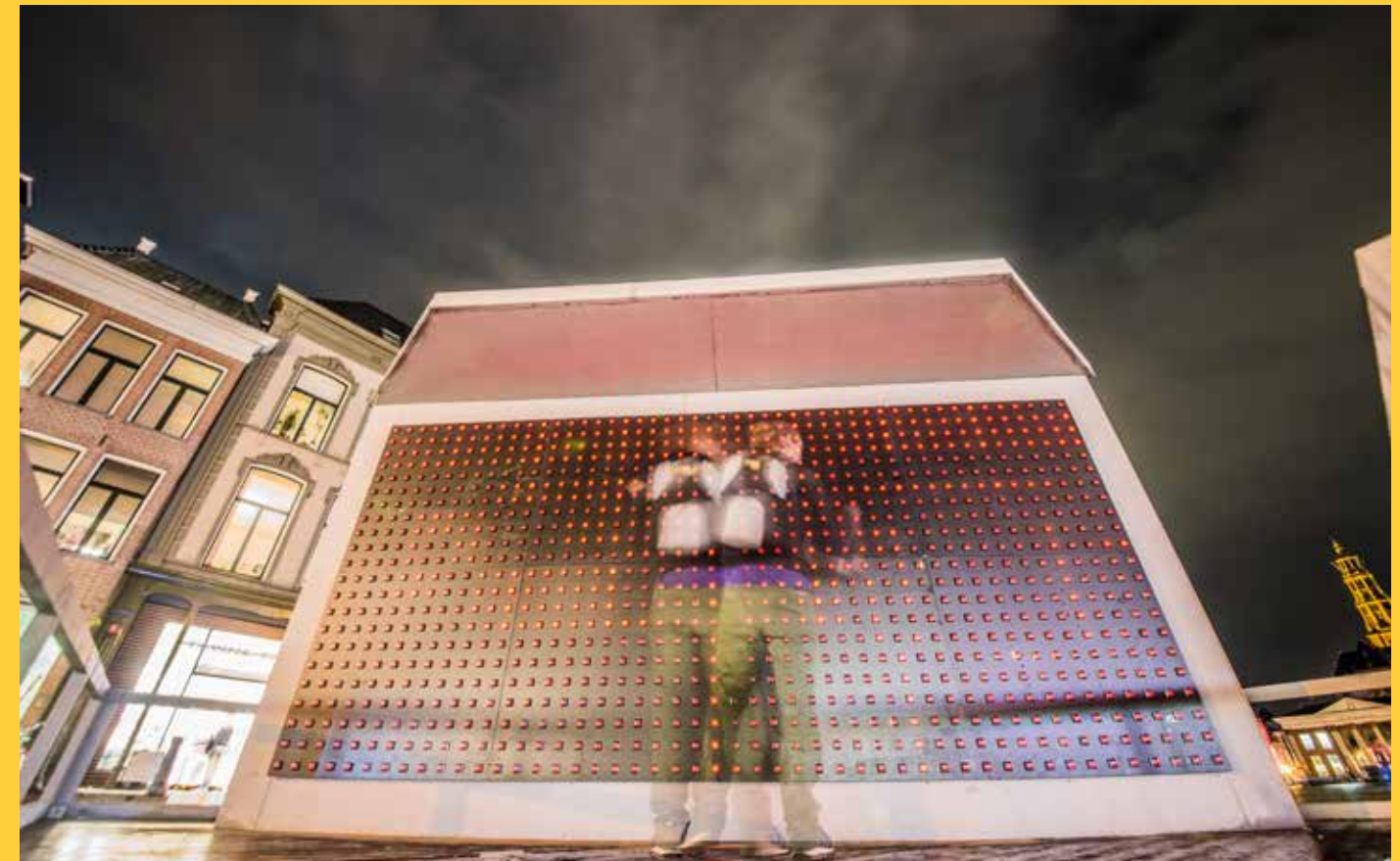
ONDER: 2017: Action>Reaction (F: S)