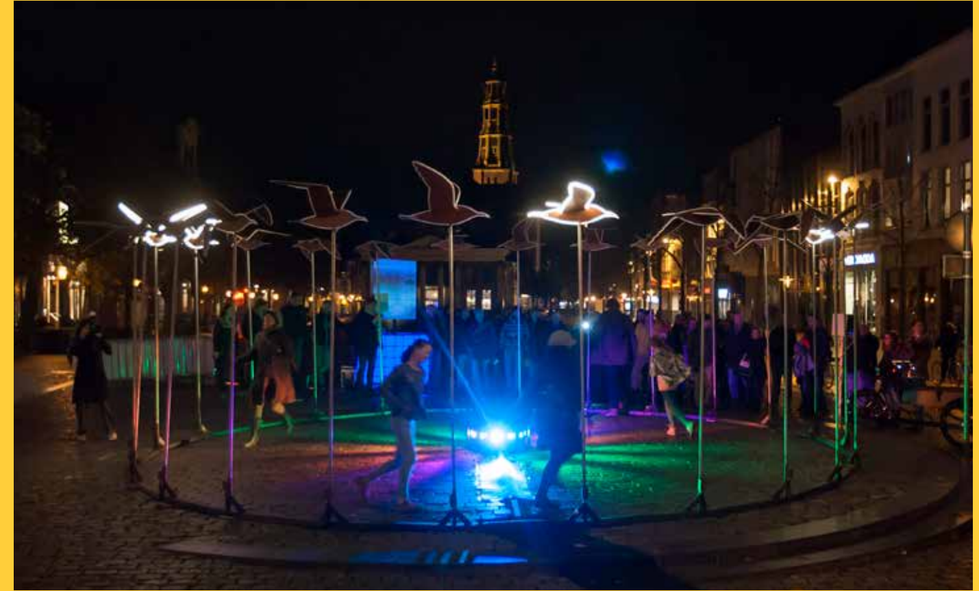
BOVEN: 2016: Birds fly with you (F: RK)