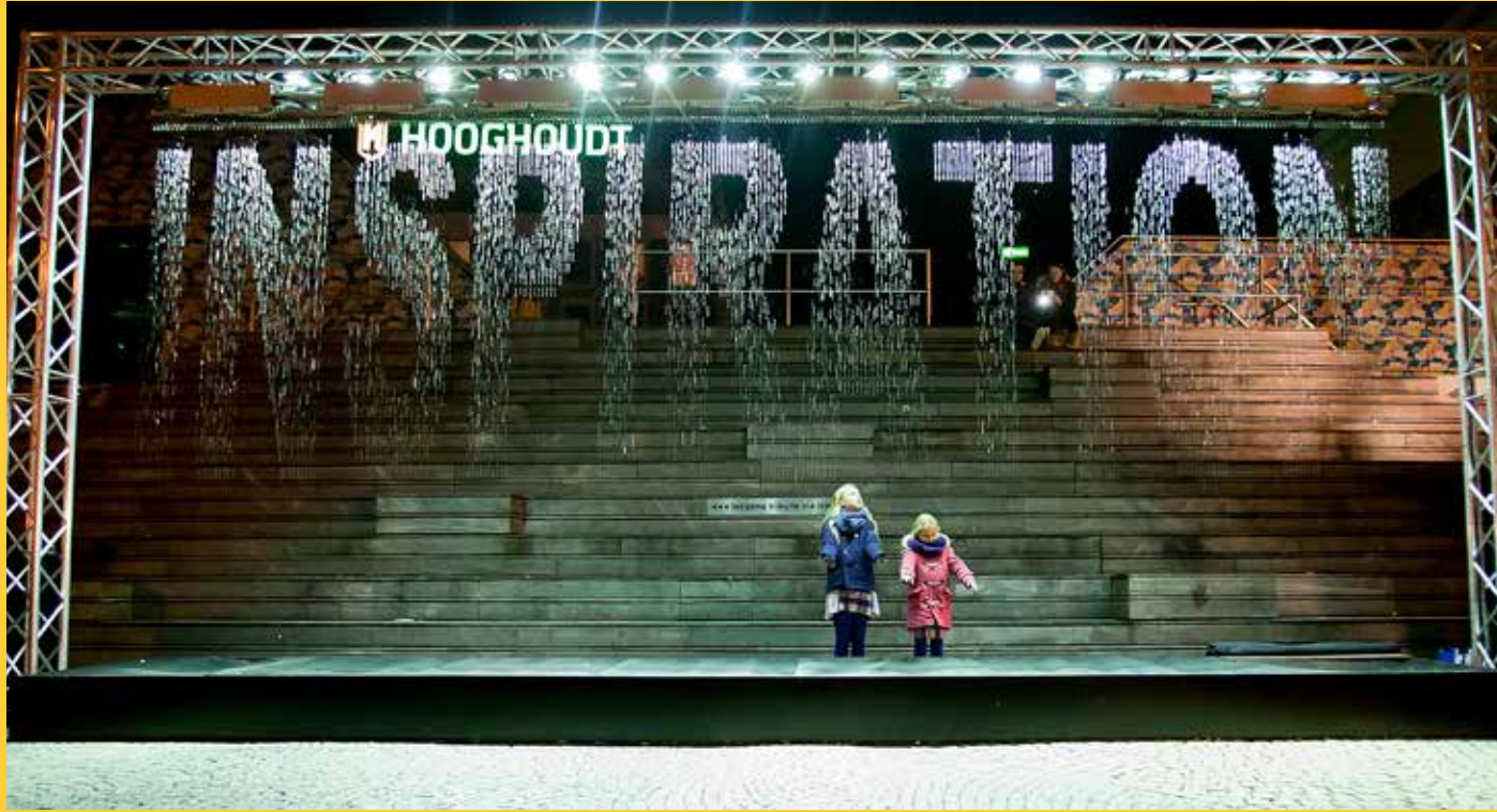
BOVEN: 2014: Bit.Fall

Vanaf 2014 zijn we in samenwerking met CBK Groningen begonnen om kunst toe te voegen aan Let's Gro. Want wat is een stad zonder kunst. Niet zomaar kunst, maar kunst om mee te spelen!