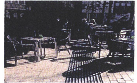
Er wordt niet altijd stil gestaan bij toegankelijkheid. Kijk naar de terrassen. Stoeltjes en tafeltjes staan nog aardig als het terras leeg is- maar gaan er mensen zitten worden de doorgangen steeds knapper.