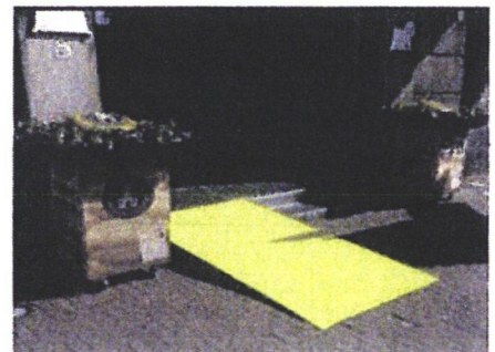
Dat winkels minder toegankelijk zijn kan te maken hebben met historische panden en inrichting. Voor een deel is dat een onontkoombaar feit, maar er is ruimte voor verbetering van de toegankelijkheid. Kleine aanpassingen en creatief denken kan een wereld van verschil maken.