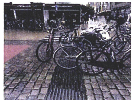
In het straatbeeld is te zien dat veelvuldig fietsen zodanig worden geparkeerd dat ze een obstakel zijn. Een flyer met daarop de oproep de fiets in de vakken te zetten zou kunnen helpen.