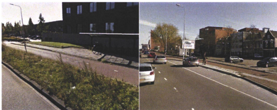
Figuur 2 Locatie Europaweg/Sontweg (links) en locatie Europaweg/Damsterdiep (rechts)

De locatie is momenteel in gebruik als bushalte, waarbij buslijn 171 nu twee keer per uur halteert. Hierover is contact geweest met het OV-bureau en Qbuzz. Zij geven aan dat het voornemen is om deze halte per december uit de dienstregeling te halen met als gevolg dat deze halte vrij is voor liftgebruik.