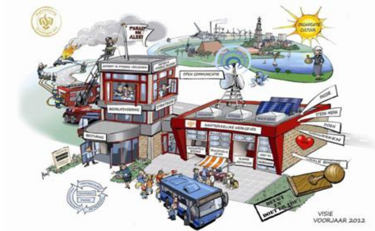
Figuur 4: de visie van Brandweer Groningen

Brandweer Groningen is expert in fysieke veiligheid en partner in integrale veiligheid. We zijn en blijven een maatschappelijk betrokken organisatie. We staan open voor innovaties en stimuleren het lerend vermogen van organisatie en medewerkers. Met slimme repressie kunnen we doeltreffender optreden. Met brandveilig leven investeren we vooral méér in het voorkómen van branden, slachtoffers en het beperken van schade. De brandweered medewerkers vormen de ruggengraat van de organisatie. We zetten in op het vakmanschap van alle medewerkers. We werken aan een open cultuur en handelen op basis van vertrouwen en integriteit. Brandweer Groningen is een aantrekkelijke werkgever met een adequaat personeelsbeleid.