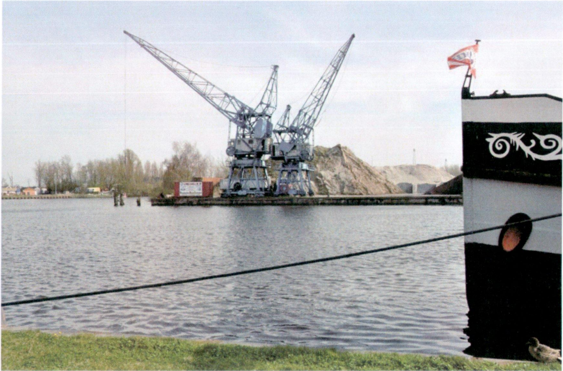
Twee voormalige gemeentelijke havenkranen, die nu langs het Eemskanaal bij de Hunzehaven staan. Onbeschermde jong erfgoed, dat mogelijk als aanjager bij de herontwikkeling van de havenpier kan worden gebruikt.

Een van de belangrijkste thema's voor de toekomst betreft het voorbereidende werk voor de brede integrale weging van cultuurhistorische waarden ten opzichte van andere omgevingswaarden. Dit is nodig om e.e.a. op te kunnen nemen in het toekomstige omgevingsplan. Als uitvloeisel van de Modernisering Monumentenzorg (MoMo) uit 2010 vraagt het rijk dit overigens al sinds 2012 van ons: weging van de (on)beschermde cultuurhistorische waarden in alle bestemmingsplannen.