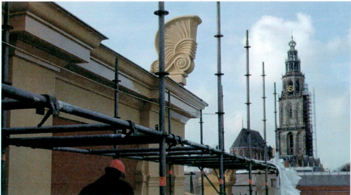
Instandhouding minder rendabel ergoed, foto: Taco Tel.

In het kader van het gemeentelijke Kanjerplan hebben we de afgelopen twee decennia ruim 50 herbestemmingen gerealiseerd. Eerst met de corporaties, vervolgens met de markt en wat de markt liet liggen met het hiervoor door ons opgerichte Groninger Monumenten Fonds (GMF). Na een langzame start heeft het GMF zijn diensten bewezen bij de revitalisering van het Prinsenhof, watertoren-noord, diverse kleinere projecten en recent bij de Schouwburg.