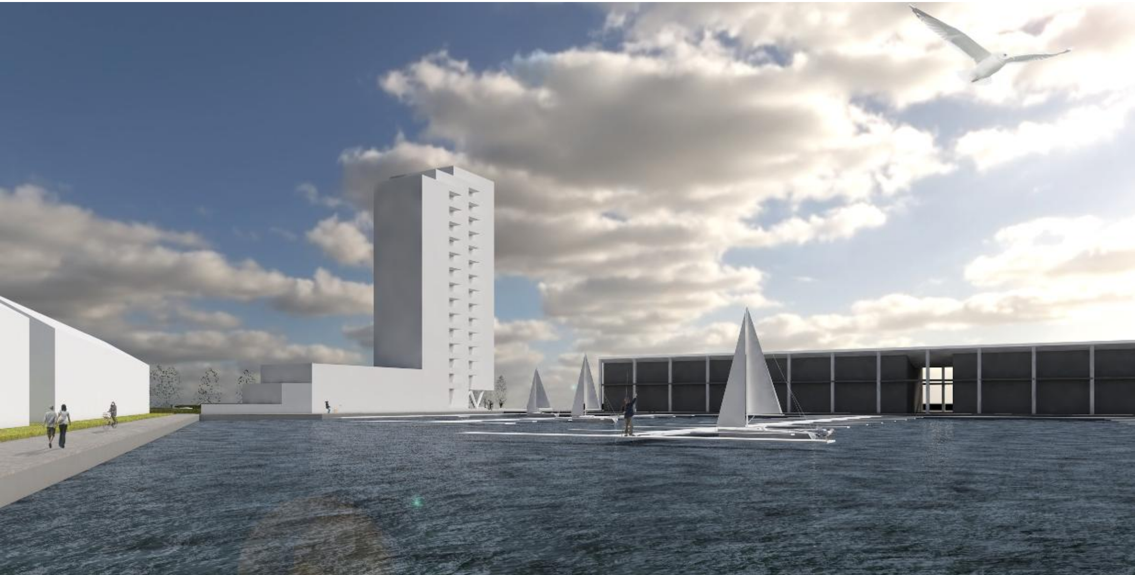
schetsontwerp woongebouw Reitdiephaven Groningen | impressie 1