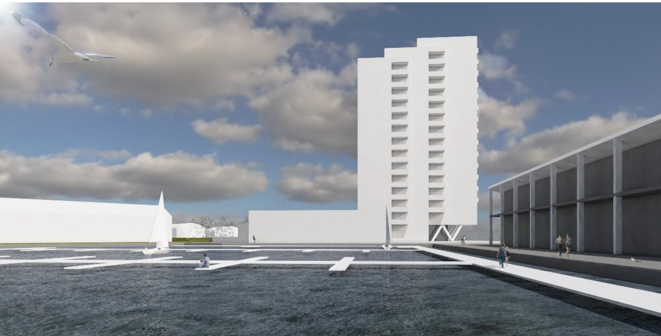
schetsontwerp woongebouw Reitdiephaven Groningen | impressie 2