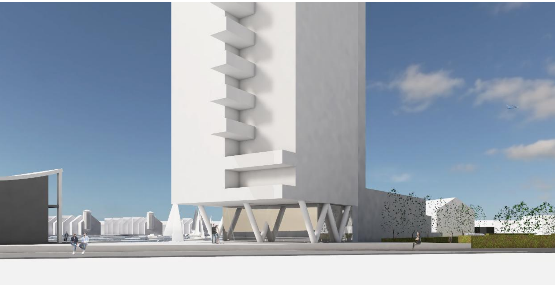
schetsontwerp woongebouw Reitdiephaven Groningen | impressie 5