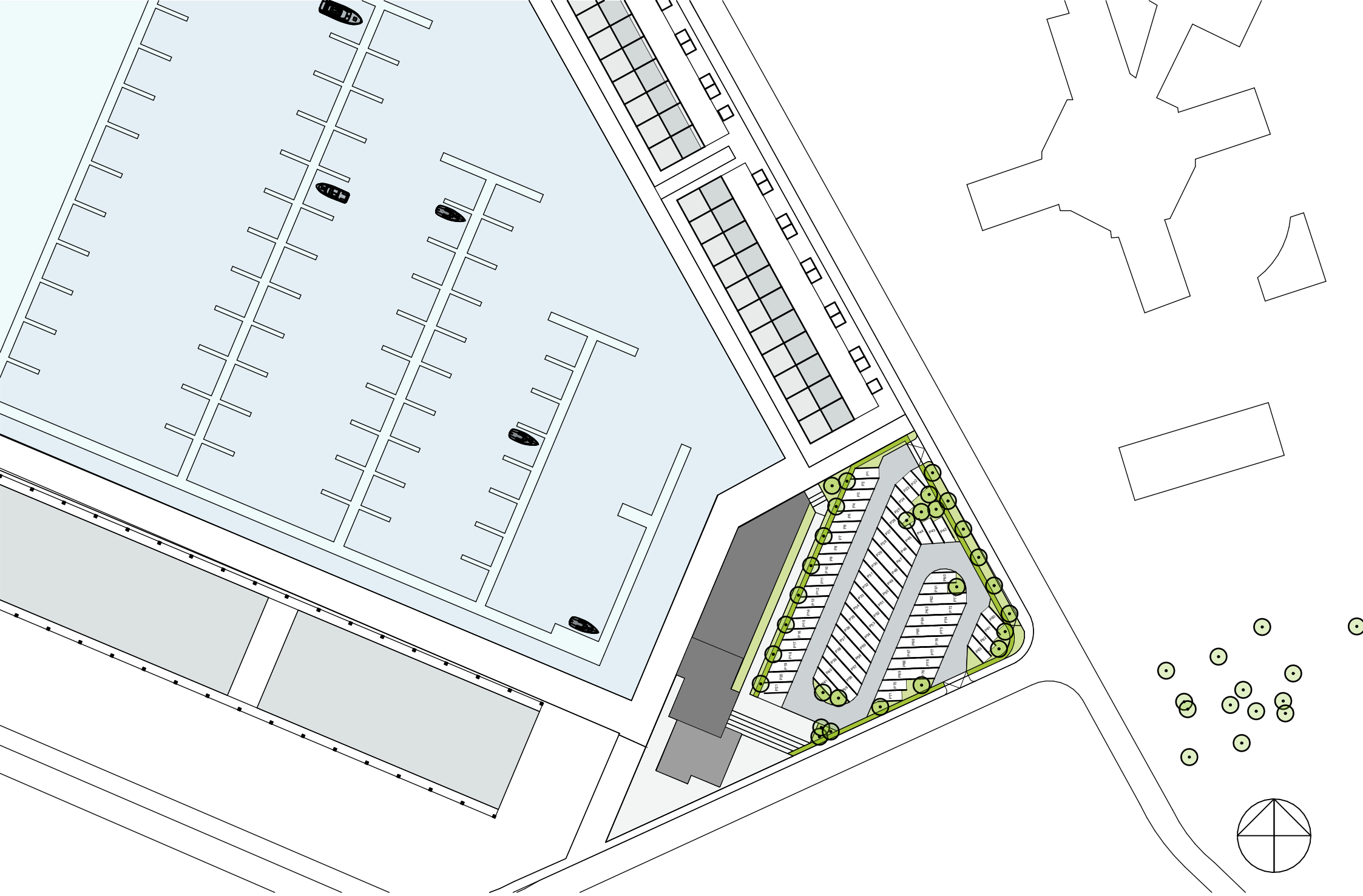
schetsontwerp woongebouw Reitdiephaven Groningen | Situatie 1:1000