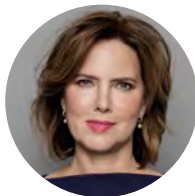
Cora van Nieuwenhuizen Minister van Infrastructuur en Waterstaat

Al met al zal er dus het nodige moeten gebeuren om onze uitstekende uitgangspositie in de logistiek te behouden en verder uit te bouwen. De ambities en doelstellingen die in dit document staan verwoord, zijn dan ook stevig. Maar alleen wanneer de lat ook daadwerkelijk hoog ligt, kan uiteindelijk gesproken worden over topprestaties. En als er iets is waar we het met zijn allen over eens zijn, dan is het dat we topprestaties willen blijven leveren en ook over enkele decennia nog een economisch gezond en in internationaal opzicht excellerend logistiek systeem willen hebben, dat tegelijkertijd een bijdrage levert aan welzijn en leefbaarheid.