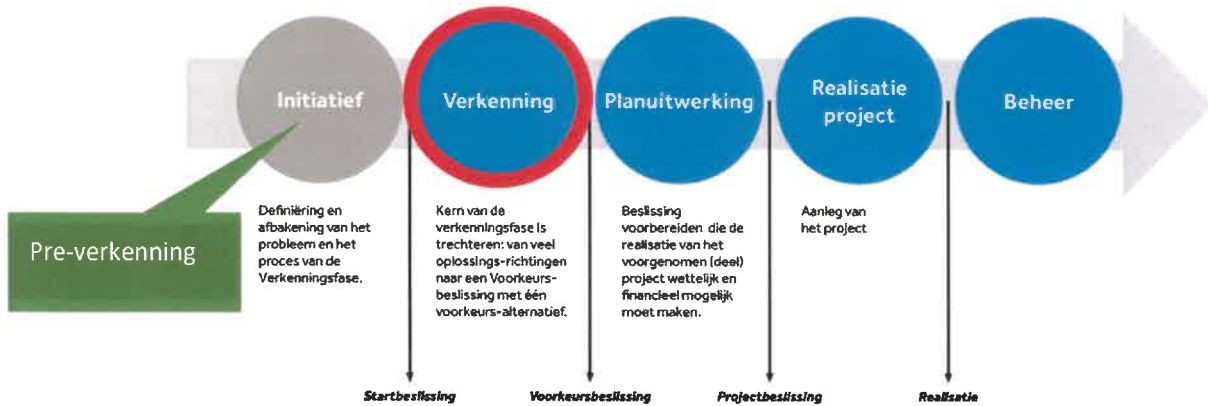
Figuur 2 De stappen in een MIRT-traject

De MIRT-verkenning oeververbinding regio Rotterdam is onderdeel van het MIRT. In dit programma werkt de Rijksoverheid samen met provincies, gemeenten en de vervoersregio's aan ruimtelijke en infrastructurele projecten. De afspraken over de financiële investeringen in deze projecten vinden plaats binnen het Bestuurlijk Overleg MIRT. In figuur 2 zijn de verschillende stappen weergegeven.