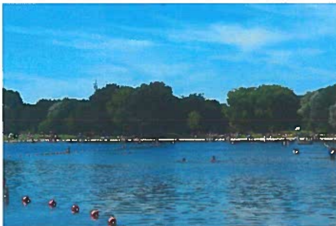
Zomerse dag bij de Hoornseplas

Daarnaast zijn nog de wandelaars die met hun hond en/of kinderen een rondje langs de Hoornseplas lopen. Deze worden door ons op zo'n 10.000 geschat.