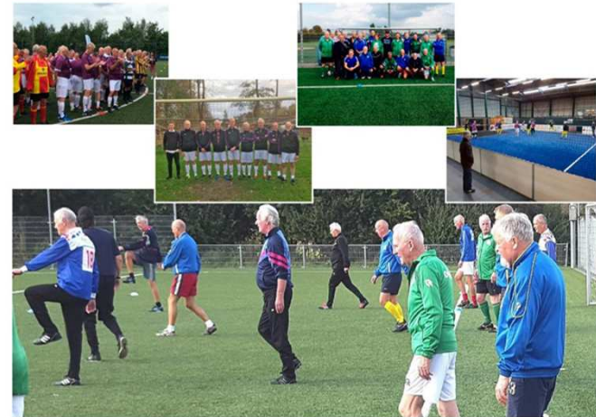
Sportwijk Beijum

Ouders geven aan dat ze verkeersveiligheid heel belangrijk vinden. Kinderen en ouders hebben samen nieuwe verkeersborden gemaakt.