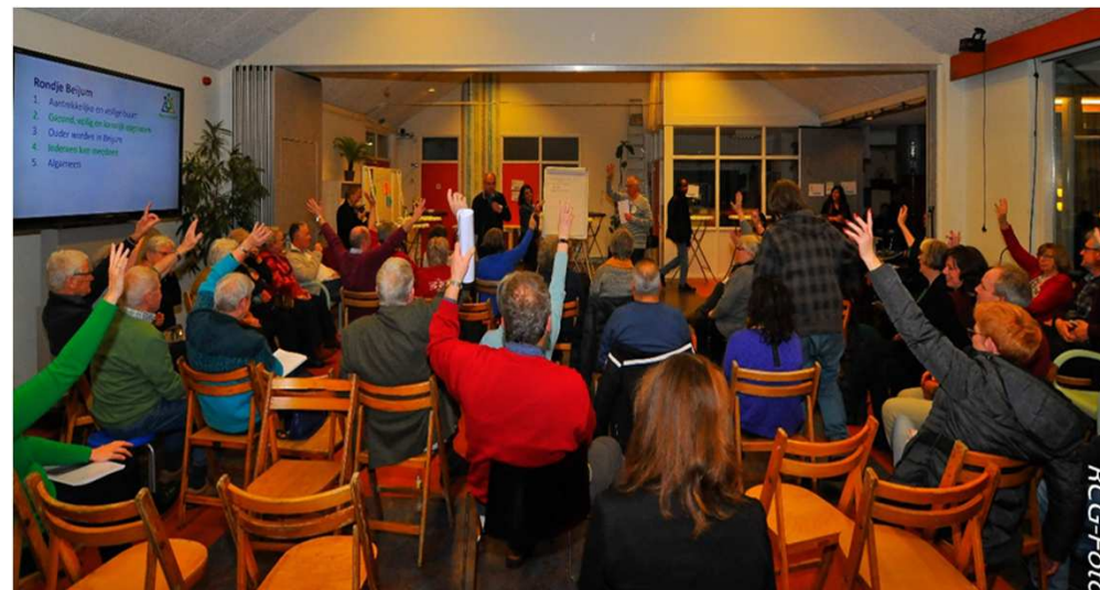
Beijumers geven aan wat ze belangrijk vinden voor de wijk tijdens de startbijeenkomst wijkvernieuwing 18 januari 2019.

De opgaves, doelstellingen en kaders voor de wijkvernieuwing van Beijum zijn door de gemeente vastgelegd in het koersdocument “Het beste tussen Stad en Ommeland” (januari 2018) en het wijkvernieuwingsplan (oktober 2018).