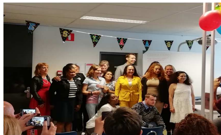
Diploma-uitreiking wijkilde Beijum 2018-2019.