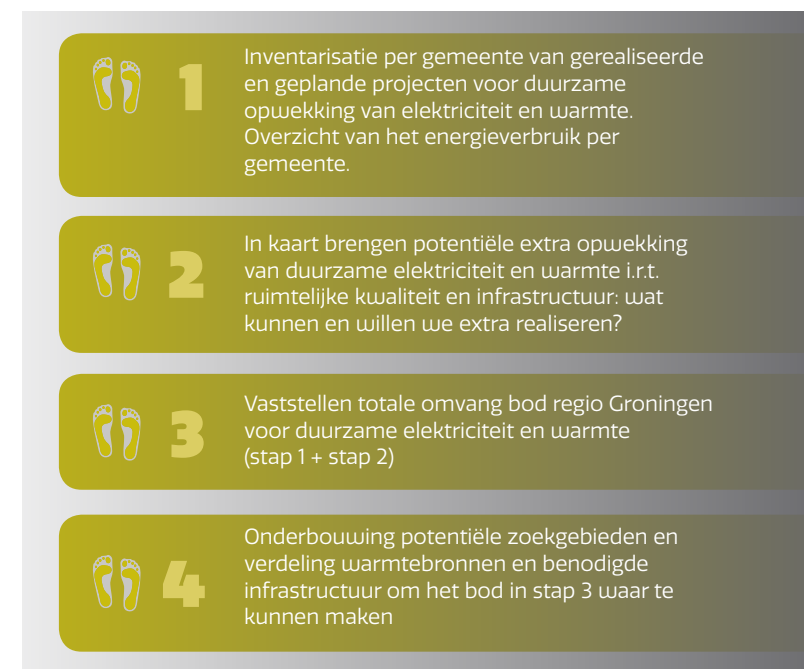
FIGUUR 5: STAPPENPLAN GRONINGS BOD

Figuur 5 geeft de stappen weer om in Groningen tot een gezamenlijk RES-bod te komen. De stappen 1 en 2 zijn iteratief. In deze stappen worden bestaande projecten, geplande projecten en (beleids)plannen van duurzame opwekking van elektriciteit en warmte opgeteld. Ook wordt per gemeente een overzicht gegeven van het (verwachte) energieverbruik (stap 1). Daarna volgt een analyse van wat additioneel mogelijk en gewenst is. Dit is de belangrijkste input om in stap 3 tot een gezamenlijk bod van de regio Groningen te komen. Tot slot wordt het bod onderbouwd en uitgewerkt naar 'potentiële zoekgebieden' tot de uiteindelijke concept RES (stap 4). Uiterlijk juni 2020 wordt de concept RES ingediend bij het Nationaal Programma RES.