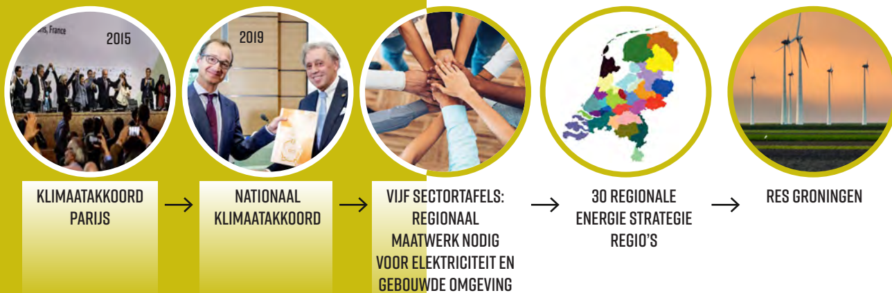
FIGUUR I: NATIONALE DOELSTELLING DUURZAME OPWEKKING ELEKTRICITEIT EN GEBOUWDE OMGEVING (7 MILJOEN WONINGEN EN 1 MILJOEN GEBOUWEN).

1,5 miljoen gebouwen aardgasloos in 2030 en alle gebouwen (8 miljoen) aardgasloos in 2050.