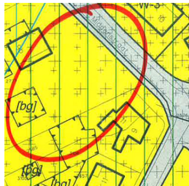
Afb. 1 Verbeelding bestemmingsplan (1987)