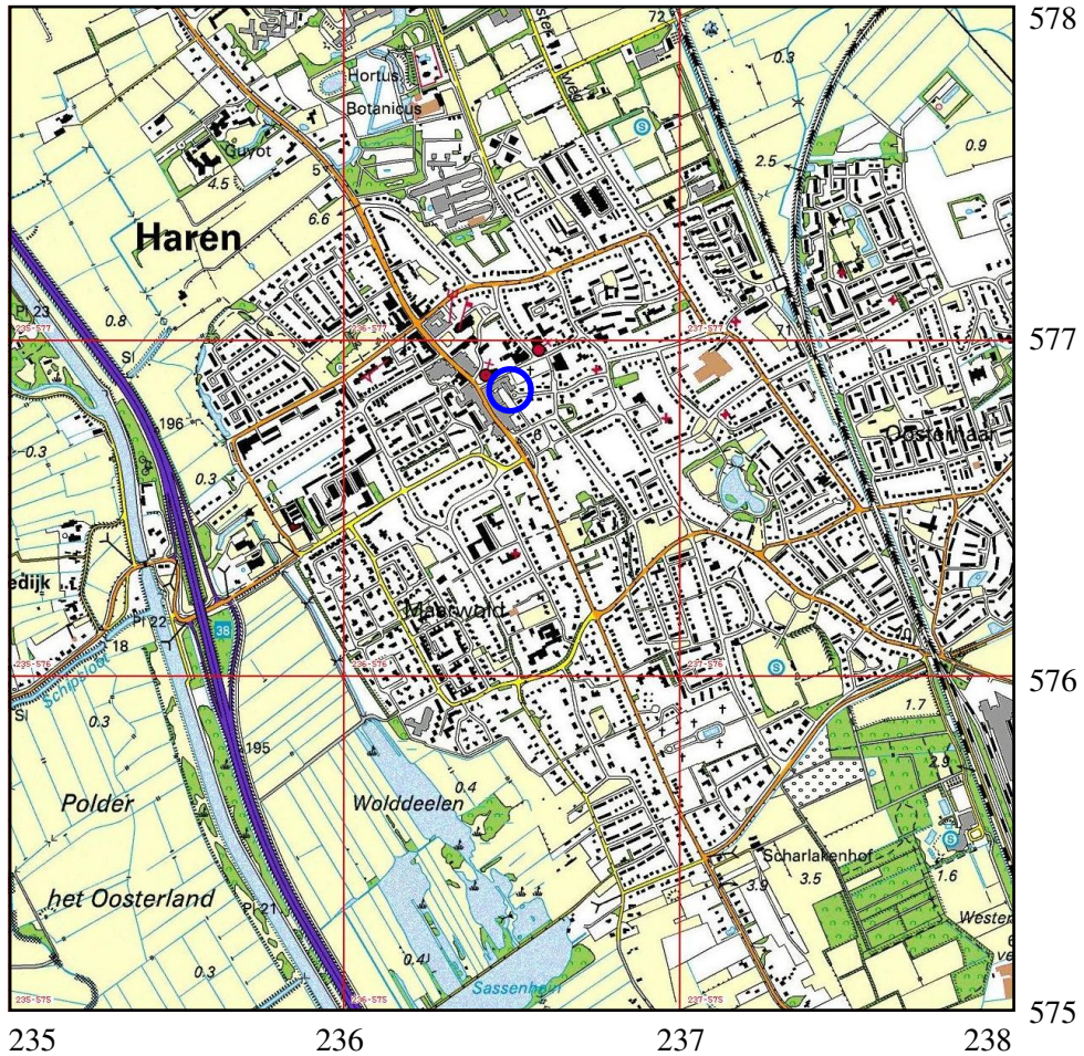
Afbeelding 1. Topografische kaart van de onderzoekslocatie (blauwe cirkel) en omgeving, voorzien van RD-coördinaten.