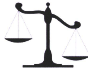
Figuur 4: Gedogen, een afweging van belangen

Voor het gedeelte dat gedoogd wordt, dient er sprake te zijn van een bijzondere omstandigheid zoals bij de 'reguliere' gedoogbeschikking. Met andere woorden het toetsingskader van het gedoog gedeelte van de partiële handhavingbeschikking is identiek aan dat van de gedoogbeschikking; namelijk passend binnen het gedoogkader. De regel blijft dus dat een handhavingsbesluit gericht moet zijn op het volledig beëindigen of ongedaan maken van (de gevolgen van) een overtreding, tenzij er sprake is van 'bijzondere omstandigheden'.