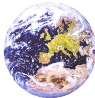
Figuur 1: De te beschermen omgeving

In hoofdstuk 6 staan de overlegstructuur en de informatie-uitwisseling beschreven en de rol van de provincie daarin. Daarnaast worden in dit hoofdstuk de situaties beschreven waarin meerdere bevoegde gezagen gelijktijdig of na elkaar bevoegd gezag zijn.