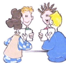
Figuur 5: Beter resultaat door samenwerken

Om goed te kunnen samenwerken is een overlegstructuur noodzakelijk. In paragraaf 5.2 van de Wabo is vastgelegd dat VTH-werkzaamheden op provinciale schaal op elkaar afgestemd moeten worden en dat daarvoor één of meer overlegorganen moeten worden ingesteld. In de Provincie Groningen is daar samen met de Provincie Drenthe uitvoering aan gegeven door het instellen van een Bestuurlijk Strategisch VTH-overleg. In onderstaande tabel 5 zijn ook de overige overleggen genoemd, met daarbij de belangrijkste kenmerken per overleg. Alle genoemde overleggen worden 'Wabo-breed' georganiseerd.