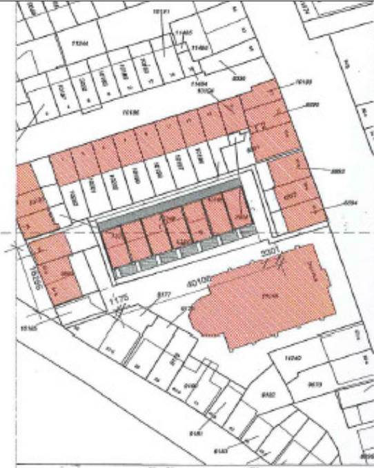
KADASTER TEKEMING GEWIJZIGDE TOESTAND