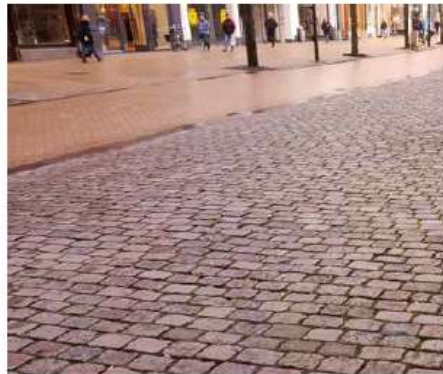
A. De stadsruimte (geel) De dynamiek van de stad