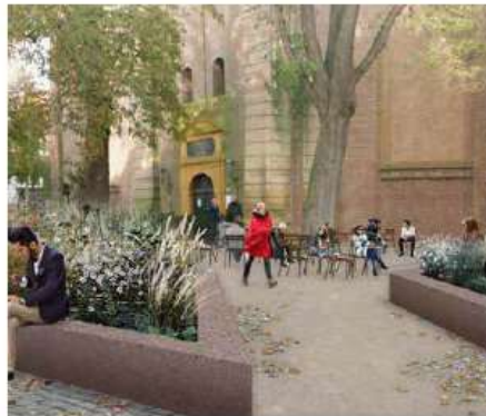
C. Omsluiting van het nieuwe hof met plantbakken. Een combinatie van zitranden en aantrekkelijk groen op maaiveld