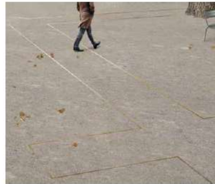
D. Halfverharding binnen het hof E. Markering verloren travee door middel van messing strips in halfverharding.