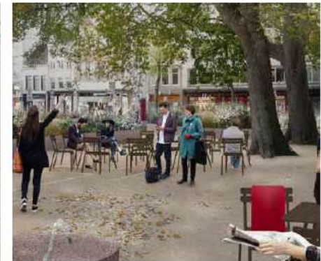
F. Verplaatsbare stoelen en tafels voor een informele ontspannen sfeer