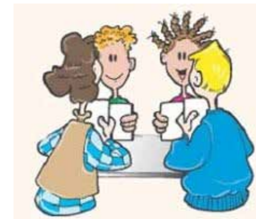
Figuur 5: Beter resultaat door samenwerken

Om goed te kunnen samenwerken is een overlegstructuur noodzakelijk. In paragraaf 5.2 van de Wabo is vastgelegd dat VTH-werkzaamheden op provinciale schaal op elkaar afgestemd moeten worden en dat daarvoor één of meer overlegorganen moeten worden ingesteld. In de Provincie Groningen is daar samen met de Provincie Drenthe uitvoering aan gegeven door het instellen van een Bestuurlijk Strategisch VTH-overleg. In onderstaande tabel 5 zijn ook de overige overleggen genoemd, met daarbij de belangrijkste kenmerken per overleg. Alle genoemde overleggen worden 'Wabo-breed' georganiseerd.