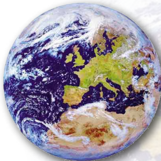
Figuur 1: De te beschermen omgeving

Voor u ligt het resultaat: de Toezicht- & Handhavingstrategie WABO Groningen (2016). Een strategie die ertoe moet bijdragen dat de bevoegde overheden bij de uitvoering van VTH-taken zodanig eenduidig, rechtvaardig en transparant optreden dat het rechtsgevoel in de maatschappij wordt gerespecteerd en de leefomgeving veilig, schoon en gezond blijft.