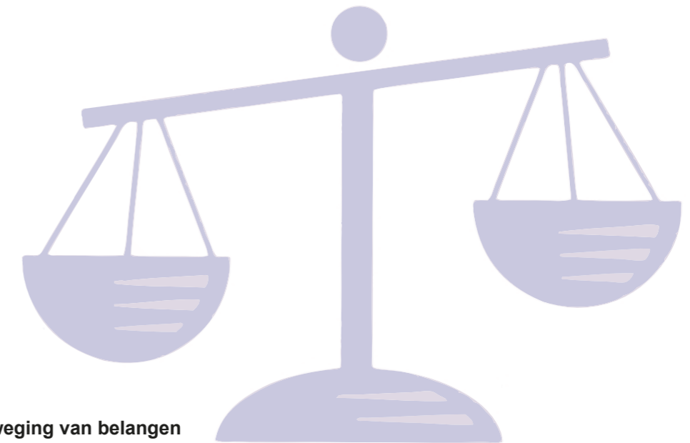
Figuur 4: Gedogen, een afweging van belangen

Voor het gedeelte dat gedooft wordt, dient er sprake te zijn van een bijzondere omstandigheid zoals bij de 'reguliere' gedoogbeschikking. Met andere woorden het toetsingskader van het gedoog gedeelte van de partiële handhavingbeschikking is identiek aan dat van de gedoogbeschikking; namelijk passend binnen het gedoogkader. De regel blijft dus dat een handhavingsbesluit gericht moet zijn op het volledig beëindigen of ongedaan maken van (de gevolgen van) een overtreding, tenzij er sprake is van 'bijzondere omstandigheden'.