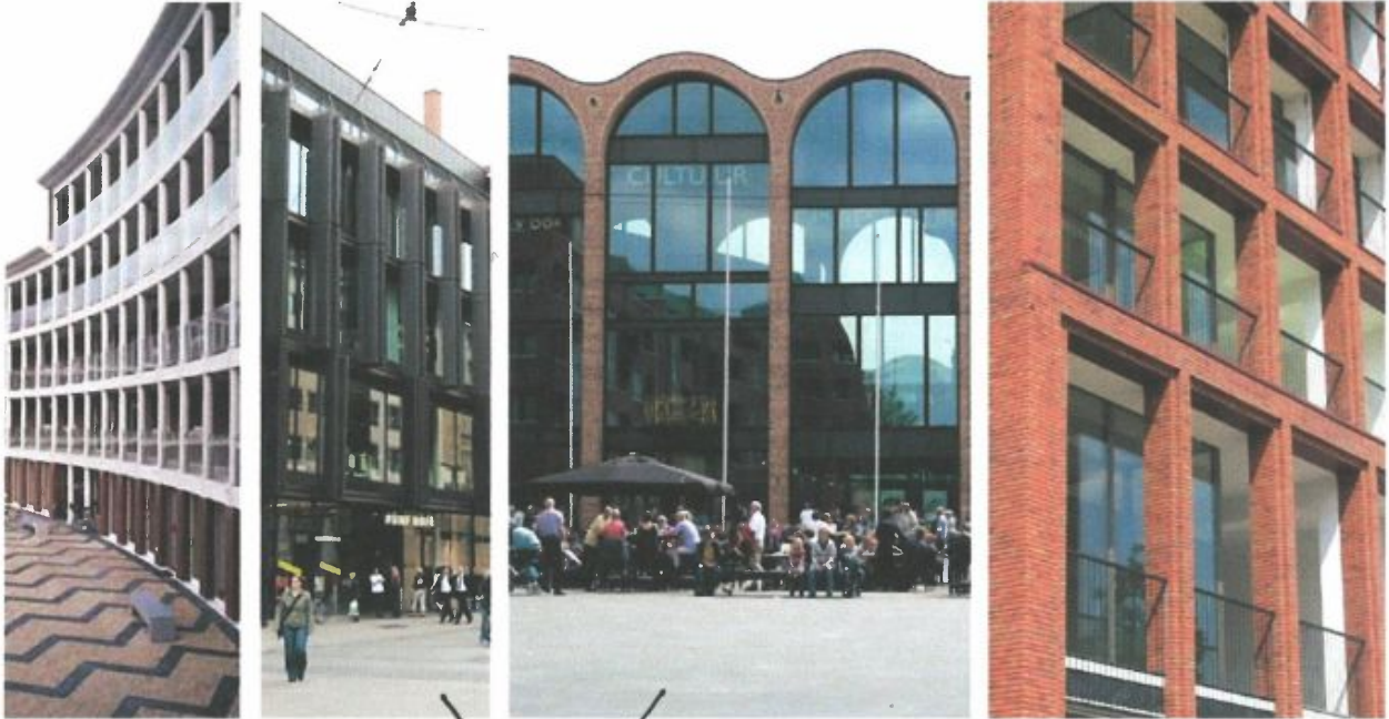
Referentiebeelden gevelopbouw Raadhuisplein