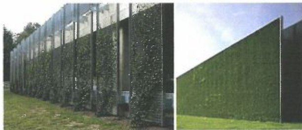
Gevelmaterialen groen: als gevelscherp expeditie ruimte