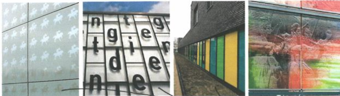
Gevelmaterialen glas: prints, kleur, licht