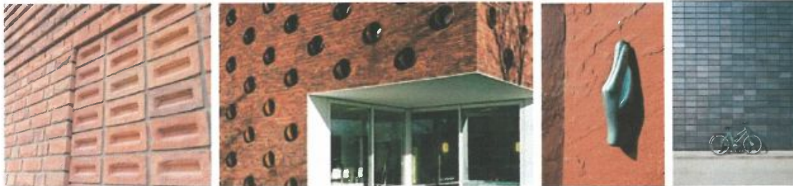
Gevelmaterialen metselwerk: reliëf, verband, textuur

Do's: ALLE 4: IS DIT NOG 'LEUK' OVER 25 JAAR?