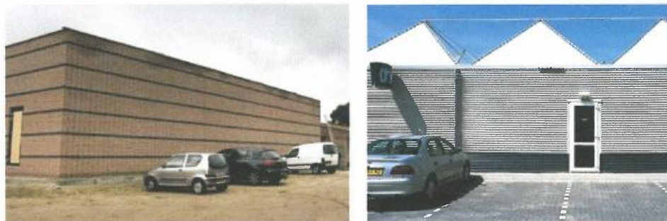
Geen blinde gevels of cladding