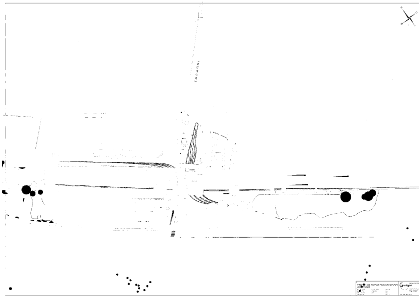
Figuur 4: (in rood) zeven bomen die extra gekapt worden vanwege viersporigheid.